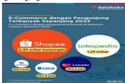
Gambar 1. Data e-commerce yang sering dikunjungi.

jumlah kunjungan website paling banyak di Indonesia pada tahun 2023. Berikut ini merupakan gambaran e-commerce dengan kunjungan yang paling sering digunakan di Indonesia.