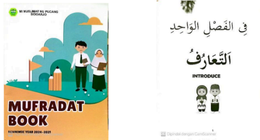
Gambar. 2 Tampilan Mufrodat Book (gambarnya discan)

Dalam proses pembelajaran bahasa arab, kebutuhan akan kamus untuk memudahkan siswa memahami kosa kata bahasa arab sangatlah besar [29]. Buku pendukung atau pelengkap diperlukan sebagai media pembelajaran pendukung selain satu buku untuk penguasaan bahasa asing yang efisien [30]. Seperti halnya MIMNU menciptakan Mufrodat book yang dirancang khusus untuk membantu pembelajaran dalam menguasai kosa kata bahasa arab secara sistematis dan bertahap. Buku ini menggabungkan kosakata sehari-hari yang sering digunakan dalam percakapan dengan kosakata akademik yang berkaitan dengan materi pelajaran dalam textbook sesuai jenjang kelas. Setiap kelas memiliki materi yang berbeda, disesuaikan dengan tingkat pemahaman pembelajaran. Selain itu, mufrodat book berfungsi sebagai alat bantu siswa untuk memahami kosa kata sehari-hari. Bahasa yang digunakan dalam mufrodat book sama halnya dengan textbook, menggunakan bahasa arab dan bahasa inggris.