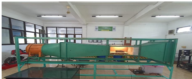
Gambar 1. Alat Uji Wind Tunnel (terowongan angin)

Penelitian ini menggunakan metode eksperimental dengan pendekatan simulasi dan uji terowongan angin untuk menganalisis pengaruh winglet bumper dan rear spoiler terhadap gaya hambat udara pada mobil jenis mpv. Elemen yang diuji meliputi winglet bumper, rear spoiler, serta kombinasi antara winglet bumper dan rear spoiler. Kondisi batas pengujian dilakukan dengan variasi kecepatan angin sebesar 7 m/s, 8,5 m/s, dan 10 m/s. Model mobil yang digunakan memiliki dimensi panjang 25 cm, tinggi 10,5 cm, lebar 9,5 cm. Variabel terikat dalam penelitian ini adalah gaya drag ( F_d ) yang diukur pada setiap kombinasi elemen dan kecepatan angin. Analisis dilakukan untuk mengevaluasi pengaruh masing-masing elemen, baik secara terpisah maupun bersamaan, terhadap efisiensi aerodinamis kendaraan.