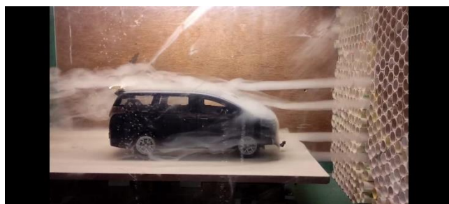
Gambar 8. Mobil Dengan Winglet Bumper dan Rear Spoiler

Gambar 8 menunjukkan pola aliran pada mobil yang telah dimodifikasi menggunakan kombinasi winglet bumper dan rear spoiler. Dari pola aliran asap terlihat adanya kontrol aliran yang baik dari rear spoiler. Sementara itu, penambahan winglet bumper tampak memberikan efek pengarah aliran di bagian bawah dan samping kendaraan. Hal ini terlihat dari aliran yang lebih bersih dan tertata di sisi bawah depan kendaraan. Di bagian belakang, aliran juga tampak lebih stabil dengan pengurangan signifikan pada daerah wake (area turbulensi di belakang kendaraan).