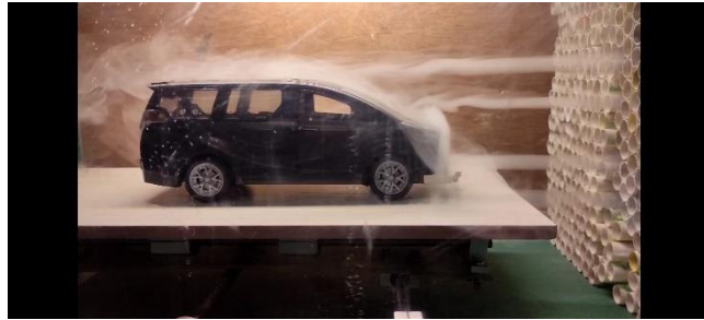
Gambar 6. Mobil Dengan Winglet Bumper