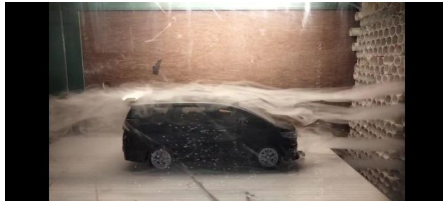
Gambar 7. Mobil Dengan Rear Spoiler

Gambar 7 menunjukkan pola aliran udara pada mobil MPV yang telah dimodifikasi dengan penambahan rear spoiler. Dari pola aliran asap yang terlihat di bagian belakang mobil, terutama di area atas aliran udara tampak lebih tertata dan tidak menunjukkan pemisahan aliran (flow separation) yang besar. Hal ini menandakan bahwa spoiler berhasil mengurangi pembentukan wake yang besar dan turbulen di belakang kendaraan. Pengurangan area wake ini memberikan penurunan hambatan aerodinamis (drag) dan peningkatan stabilitas kendaraan pada kecepatan tinggi.