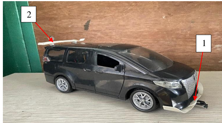
Gambar 2. Alat Uji Wind Tunnel (terowongan angin)