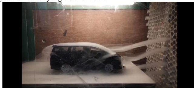
Gambar 5. Mobil Tanpa Modifikasi

Gambar 5 menunjukkan pola aliran udara pada mobil tanpa modifikasi. Sebagian besar aliran udara di atas kap dan atap mobil tampak cukup halus dan mengikuti kontur bodi kendaraan. Namun, di bagian belakang mobil terlihat indikasi adanya pemisahan aliran (flow separation), yang ditandai dengan turbulensi atau pusaran aliran yang tidak teratur.