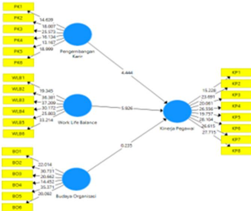
Gambar 1. Output Bootstrapping