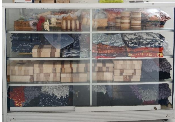
Gambar 2. Hasil Produk Handicraft UPTD Liponsos Keputih

“Kalau hasil produksinya sudah banyak ya kita ganti kerajinan lain mbak, yang lebih menarik dan punya daya nilai jual. Seperti dulu merajut alas kaki atau keset, ini sekarang pembuatan kotak tisu dari pelepah pisang juga strap HP”. (Hasil wawancara 20 Februari 2025)