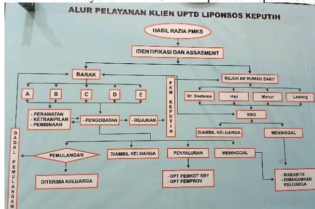
Gambar 1. Alur Pelayanan Klien UPTD Liponsos Keputih Surabaya.

Sebagaimana digambarkan dalam Alur Pelayanan Klien UPTD Liponsos Keputih Surabaya, dimana klien diterima oleh UPTD yang selanjutnya akan dilakukan asesmen awal untuk menilai kondisi kesehatan dan kebutuhan spesifik mereka. Klien yang membutuhkan penanganan medis lebih lanjut akan dirujuk ke rumah sakit mitra dengan didampingi oleh pendamping klien.