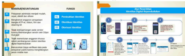
Gambar 1. Materi Sosialisasi Saat Turun Lapangan di Kecamatan Sidoarjo

"Menurut ibu, sudah sangat jelas ya nduk. Soalnya setelah diarahkan untuk download aplikasinya kita juga dikasih cara melihat dokumennya dan diingatkan buat langsung ganti pinnya. Soalnya aplikasi inikan ada keamanan pin karena menyangkut dokumen yang harus dijaga dan pinnya pun gak boleh sampai lupa. Jadi waktu setelah disuruh ganti ke pin baru juga dibantu untuk mencatat di HP biar ndak lupa. Nah, baru kemudian dijelaskan manfaatnya". (Hasil wawancara pada tanggal 04 Desember 2024)