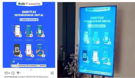
Gambar 2. Dokumentasi Saluran Informasi Terkait Layanan IKD

"Kalau terkait aplikasi IKD ini saya taunya saat kunjungan langsung ke kantor kecamatan karena saya mengurus KK dan ditawarkan langsung oleh petugasnya. Dari segi teknisnya pun waktu itu memang ada kendala di kode aktivasi yang belum masuk ke email tapi petugasnya langsung membantu melakukan penyelesaiannya. Kalau dari penjelasan petugas juga kita disuruh aware dalam menjaga keamanan data karena sifatnya kan bisa kristal ya mba". (Hasil wawancara pada tanggal 07 Desember 2024)