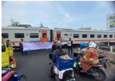
Gambar 1. Perlintasan Kereta Api Sebidang Daop 8 Gedangan Sidoarjo Sumber : Hasil dokumentasi saat melakukan penelitian

Strategi Humas Daerah Operasi 8 Surabaya yaitu dengan cara bersosialisasi di pelintasan sebidang yang berpalang pitnu maupun tanpa palang pintu. Target sasaran kegiatan sosialisasi Pengguna Jalan Kegiatan sosialisasi dilaksanakan di perlintasan sebidang Daop 8 daerah Gedangan, Sidoarjo.