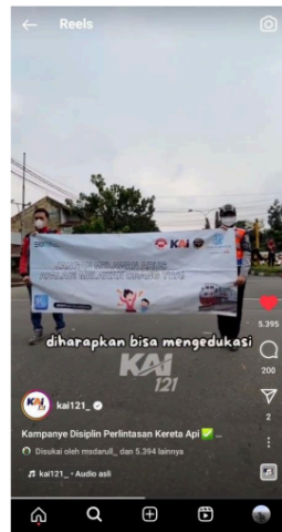
Gambar 3 Edukasi di media sosial Instagram

Humas PT. KAI Daop 8 Surabaya menggunakan media internet seperti instagram untuk memberikan informasi berupa konten edukasi kepada masyarakat mengenai keselamatan perjalanan saat melintasi perlintasan kereta api, dengan menjelaskan bahaya saat menerobos perlintasan serta merugikan diri sendiri dan pihak PT. KAI.