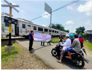
Gambar 2. Jalan Kereta Api Sebidang Daop 8 Tidak Berpalang di Bangil Pasuruan

Kecelakaan lebih sering terjadi pada pelintasan tanpa palang pintu di karenakan tidak ada tanda tanda bahwa kereta akan melintas. Maka dengan strategi ini Humas melakukan sosialisasi dengan masyarakat untuk memberikan himbauan agar berhenti sejenak sebelum melintasi perlintasan dan menengok kanan kiri untuk melihat apakah ada kereta atau tidak.