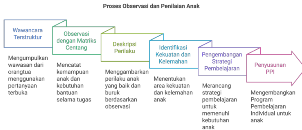
Bagan 1. Alur Observasi ABK Metode TEACCH

Teknik pencatatan observasi yang digunakan adalah checklist menggunakan matriks yang disusun oleh UPTD Anak Berkebutuhan Khusus Sidoarjo berdasarkan metode TEACCH. Metode pencatatan checklist sistematis mengungkapkan informasi frekuensi tentang keberadaan atau ketidakberadaan suatu tindakan (Anshori dkk., 2024). Matriks ini terdiri dari 3 tahap. Yang pertama matriks checklist untuk melihat perilaku anak. Yang kedua matriks perencanaan deskripsi untuk mendeskripsikan perilaku anak yang muncul saat observasi. Yang ketiga matriks perencanaan sebagai dasar untuk menyusun strategi pembelajaran anak (PPI) kedepannya. Berikut alur observasi yang peneliti lakukan menggunakan matriks dari metode TEACCH :