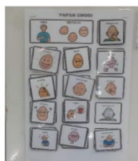
Gambar 2. Pengenalan emosi