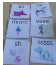
Gambar 4. Ling 6 Sound Cards

Dalam aspek kognisi, Anda dapat melatih kemampuan membaca dan menulisnya menggunakan flashcard . Media edukatif yang disebut flashcard ini adalah kartu yang memuat gambar dan kata yang ukurannya dapat disesuaikan dengan ukuran siswa. Guru dapat membuat kartu sendiri atau menggunakan yang sudah ada. Media pembelajaran flashcard dapat membantu mengembangkan daya ingat, melatih kemandirian dan meningkatkan jumlah kosakata (Stefani & Samsiyah, 2020).