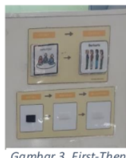
Gambar 3. First-Then