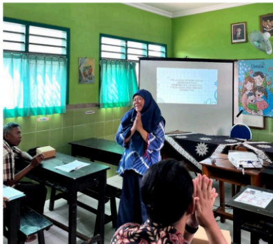
Gambar 2. Penyampaian materi pola asuh positif oleh narasumber