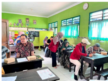
Gambar 3. Pembagian pos test kepada peserta