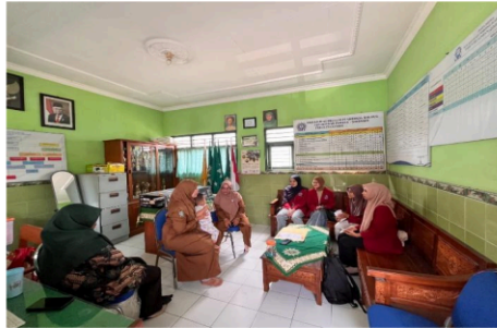
Gambar 1. Survei awal bersama kepala sekolah dan guru di SLB Aisyiyah Porong