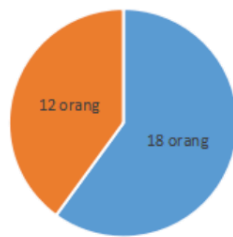
Gambar 1. Survei awal QLC

Penyebaran skala dilakukan dengan menggunakan aitem yang di kembangkan dari 6 aspek quarter life crisis menurut Robbins dan Wilner. Data yang dihasilkan dari survey awal menunjukkan jika dari keenam aspek tersebut aspek terjebak dalam situasi sulit merupakan aspek dengan persentase tertinggi yaitu 19%, dapat diartikan jika individu merasa berat dalam mengambil sebuah keputusan yang menjadikan individu tersebut terjebak dalam situasi yang sulit. Pada aspek putus asa 17,6%, keputusan yang dirasakan biasanya akibat dari kegagalan, ketidakpuasan dan hasil yang sia-sia yang dialami sebelumnya. Penilaian diri yang negatif menjadi aspek dengan persentase 17,2% individu yang memandang dirinya negatif cenderung mempertanyakan dan meragukan kemampuannya dalam mengatasi tantangan hidup. Aspek kebingungan dalam mengambil keputusan dengan persentase 15,8%, disini pada usia emerging adulthood individu akan mulai menghadapi banyak pilihan di hidupnya yang dapat membuat individu merasa ketakutan hingga kebingungan dalam mengambil keputusan. Selanjutnya pada aspek khawatir terhadap