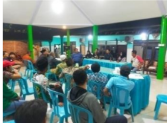
Gambar 1.1 : Musyawarah Perencanaan Pembangunan Desa Ketapang untuk Tahun 2024

Dibawah ini merupakan bukti dokumentasi kegiatan Musrenbangdes yang diadakan oleh Pemerintah Desa Ketapang dengan mengajak seluruh elemen masyarakat desa untuk merencanakan kegiatan pemberdayaan masyarakat dengan memanfaatkan Dana Desa :