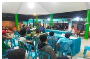
Gambar 1. Musyawarah Perencanaan Pembangunan Desa Ketapang untuk Tahun 2024

Transmisi Informasi. Informasi mengenai penggunaan Dana Desa disampaikan melalui Musrenbangdes. Pemerintah desa melibatkan berbagai elemen masyarakat untuk memastikan transparansi dan partisipasi aktif. Dalam forum ini, pemerintah desa melibatkan berbagai pihak, termasuk perangkat desa, tokoh masyarakat, dan Badan Usaha Milik Desa (BUMDes). Informasi yang disampaikan mencakup prioritas program, alokasi anggaran, dan pelaksanaan kegiatan pemberdayaan masyarakat. Di bawah ini merupakan bukti dokumentasi kegiatan Musrenbangdes yang diadakan oleh Pemerintah Desa Ketapang dengan mengajak seluruh elemen masyarakat desa untuk merencanakan kegiatan pemberdayaan masyarakat dengan memanfaatkan Dana Desa: