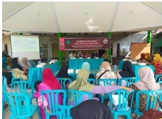
Gambar 3. Rembuk Stunting Tahun 2024

Dan berikut dibawah ini salah satu kegiatan pemberdayaan pada sub bidang Pemberdayaan Perempuan, Perlindungan Anak dan Keluarga yang telah dilaksanakan pada tahun 2024: