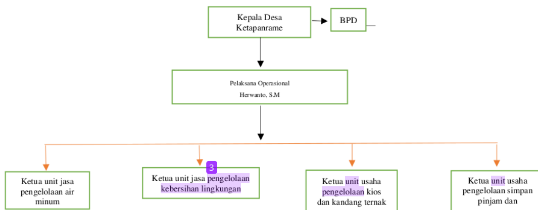
Gambar 3.2. Struktur BUMDes Mutiara Welirang,

“Struktur nya seperti tabel yang dipaparkan ya, BUMDes sebagai holding nya bagaimana unit-unit usaha di desa ini terus berjalan dan berkembang, struktur organisasi nya juga harus selaras dengan visi dan misi, pernah terjadi kelowongan pada ahli teknik kami yang paham tentang jaringan air akhirnya kami berdiskusi untuk merekrut salah satu karyawan yang ahlinya pada bidang tersebut agar unit usaha air minum ini tetap beroperasi jadi kita carikan pengganti ahli tekniknya”. (Wawancara 08 Desember 2024).