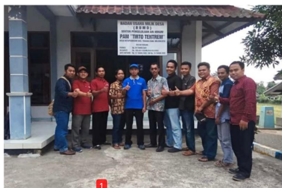
Gambar 3.5 BUMDes Mutiara Welirang 2024