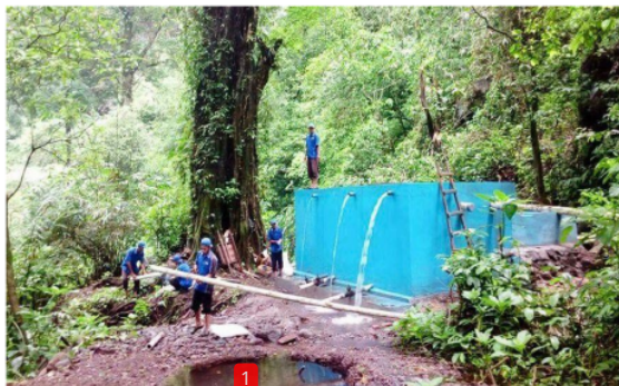
Gambar 3.4 BUMDes Mutiara Welirang