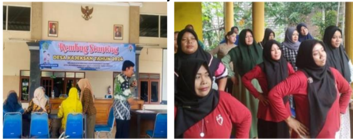
Gambar I. Kegiatan Pengarahan Rembug Stunting dan kelas Ibu hamil di Desa Kajeksan

Sumber: Diolah dari Pemerintah Desa Kajeksan, 2024.