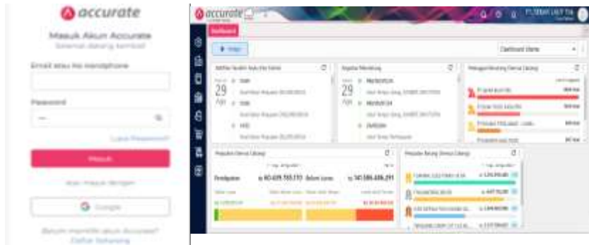
Web Login & Dashboard