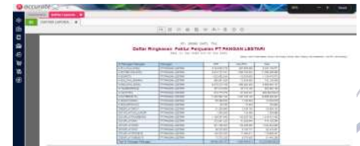
Tampilan Data Daftar Laporan Perbulan