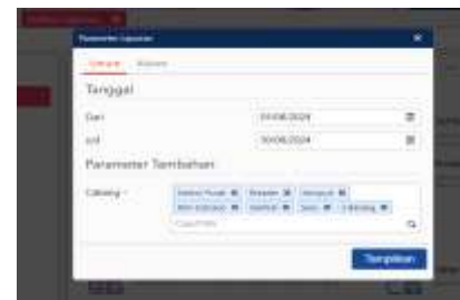
Tampilan Parameter Laporan