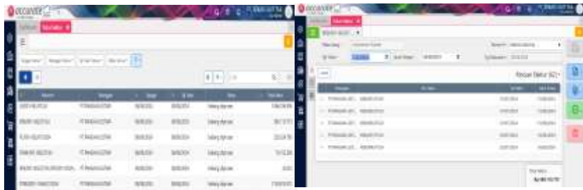
Tampilan Data & Impor Data Tukar Faktur