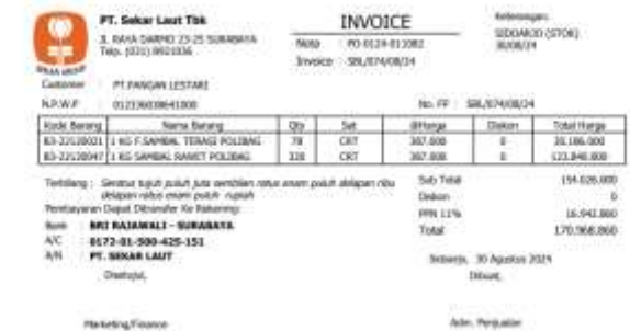
Tampilan Preview print