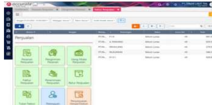
Tampilan Menu Penjualan