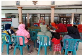
Gambar 4. Pelaksanaan Kegiatan Kelas Ibu Hamil di Desa Larangan

Berlandaskan usia kehamilan, wanita hamil memerlukan asupan energi lebih besar daripada wanita tidak hamil. Penambahan berat badan selama kehamilan merupakan elemen yang dapat menentukan kesehatan. Sangat penting guna mengetahui pertumbuhan berat badan saat kehamilan berlangsung. Apabila pertumbuhan berat badan terlalu banyak, ada risiko bahwa janin dapat mengalami obesitas. Sebaliknya, jika penambahan berat badan kurang dari yang seharusnya, bayi yang dilahirkan berpotensi mengalami kekurangan berat badan. Dalam hal ini, ibu hamil tidak hanya diberikan pendidikan mengenai stunting dan pola makan yang sehat, tetapi juga diajarkan tentang cara memenuhi kebutuhan mikronutrien yang penting. Mikronutrien tersebut termasuk asam folat, zat besi, zink, dan nutrisi lain yang sangat dibutuhkan janin. Dengan pemahaman yang baik tentang kebutuhan gizi selama kehamilan, diharapkan mengurangi risiko masalah kesehatan di masa depan. Dibawah ini adalah pelaksanaan kegiatan kelas ibu hamil yang dilaksanakan di Balai Desa Kantor Desa Larangan: