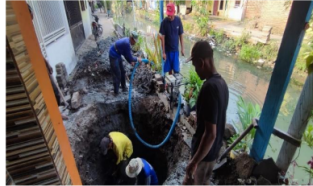
Gambar 3. Penggalian Saluran Sarana Sanitasi di Desa Larangan

di Desa Larangan, salah satu inisiatif yang diluncurkan oleh pemerintah desa adalah pengadaan sarana air bersih serta fasilitas kebersihan. Dengan memastikan bahwa masyarakat tidak menggunakan air yang berkualitas buruk atau fasilitas sanitasi yang tidak memadai, inisiatif ini diharapkan dapat secara tidak langsung mengurangi angka stunting di daerah tersebut. Berikut merupakan salah satu upaya yang dilakukan oleh Pemerintah Desa Larangan: