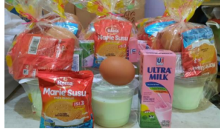
Gambar 2. Menu Produk PMT untuk balita di Desa Larangan

dari masalah gizi yang dapat menghambat perkembangan mereka di masa depan. Berikut ini adalah menu PMT yang diberikan pada saat kegiatan posyandu: