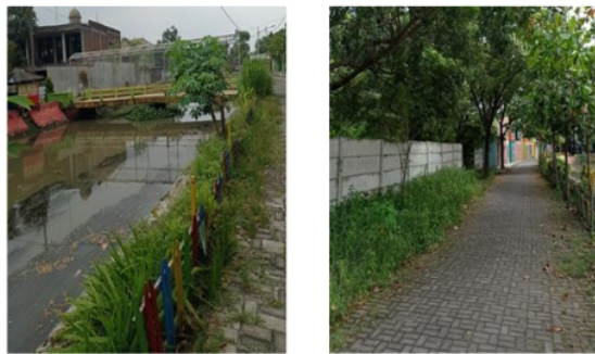
Gambar 3. Lingkungan Desa Ketapang

Data di lapangan menunjukkan terdapat persamaan dengan teori Cohen dan Uphoff dalam Ferdinand, dkk (2015:5), menyatakan bahwa partisipasi masyarakat dalam menerima hasil pembangunan tergantung pada distribusi yang dilakukan secara maksimal, suatu hasil pembangunan yang dinikmati atau dirasakan masyarakat, baik pembangunan fisik maupun pembangunan non fisik. Namun, Desa Ketapang tidak adanya aturan yang mengikat dari pihak pemerintah desa di dalam pengelolaan dan pemeliharaan lingkungan di lain sisi pemerintah desa juga membentuk tim untuk membersihkan lingkungan desa Ketapang. Oleh sebab itu, diharapkan untuk setiap warga masyarakat harus sadar akan pentingnya menjaga lingkungan sesuai program pembangunan yang sudah disepakati bersama. Namun peneliti menemukan masih rendahnya inisiasi masyarakat dalam hal menjaga lingkungan sekitar, yang ditandai dengan tercampurnya sampah organik dan anorganik. Padahal sudah ada upaya untuk membedakan antara sampah organik dan anorganik di tempat sampah dan kurangnya inisiatif masyarakat dalam membersihkan rumput liar yang tumbuh dengan lebat di sekitar lingkungan desa tepatnya di area sempadan (bantaran) sungai yang dapat dilihat pada gambar 3.