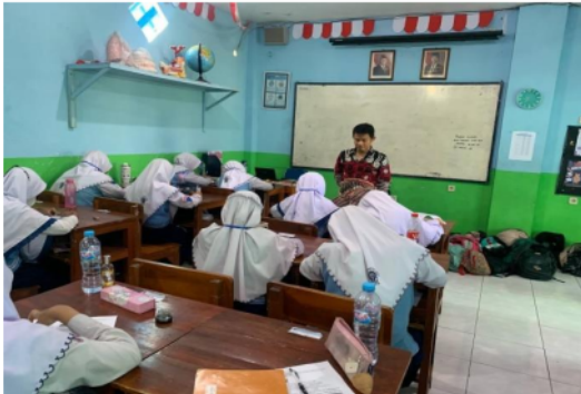
Gambar 2. Foto Kegiatan

berjudul indung indung yang diubah syairnya menjadi bahasa arab materi bilangan, adapun syairnya sebagai berikut : سبعة - delapan - ثمانية - sembilan - تسعة - sepuluh - عشرة - أحد - satu - اثنان - dua - ثلاثة - tiga - اربعة - empat - خمسة - lima - سنة - enam - سبعة - tujuh - ثمانية - delapan - تسعة - sembilan - عشرة - sepuluh 4) Siswa dapat menirukan lagu yang dinyanyikan oleh guru secara bertahap hingga mereka mampu mengikuti instruksi yang diberikan, 5) Pendidik mengajukan beberapa pertanyaan terkait materi bilangan yang telah dipraktikkan sebelumnya, 6) Guru menyebutkan berbagai hal yang berhubungan dengan bilangan dalam bahasa Arab, 7) Peserta didik kemudian menirukan dan melafalkan kata-kata yang telah diucapkan oleh guru sebelumnya, sementara guru mengamati dan memperbaiki pelafalan yang kurang tepat, 8) Guru meminta beberapa siswa maju untuk menulis tulisan dari yang mereka hafal materi bilangan di papan tulis, 9) Guru melakukan pengamatan, dan mengoreksi, memberikan penilaian hasil tulisan siswa yang ada di papan tulis.