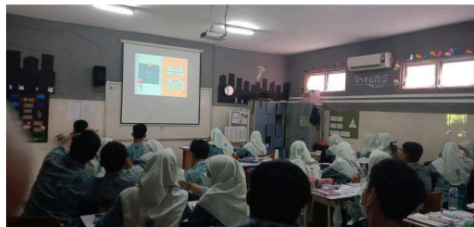
Gambar 1. Media Permainan berbasis Power Point

Hasil belajar siswa dalam hal keterampilan, sikap, kebiasaan, dan minat juga dipengaruhi oleh pembelajaran. Adanya media pembelajaran di pusat pembelajaran bahasa arab adalah salah satu cara untuk meningkatkan minat siswa sehingga mereka dapat mencapai hasil belajar yang baik karena belajar mencakup semua aspek belajar, bukan hanya penguasaan materi. [22]