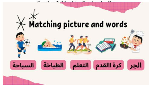
Gambar 3. Evaluasi atau muroja'ah mufrodat