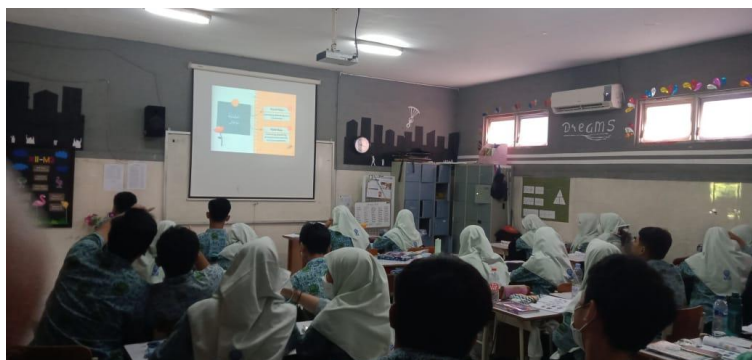
Gambar 1. Media Permainan berbasis Power Point

Hasil belajar siswa dalam hal keterampilan, sikap, kebiasaan, dan minat juga dipengaruhi oleh pembelajaran. Adanya media pembelajaran di pusat pembelajaran bahasa arab adalah salah satu cara untuk meningkatkan minat siswa sehingga mereka dapat mencapai hasil belajar yang baik karena belajar mencakup semua aspek belajar, bukan hanya penguasaan materi. [22]