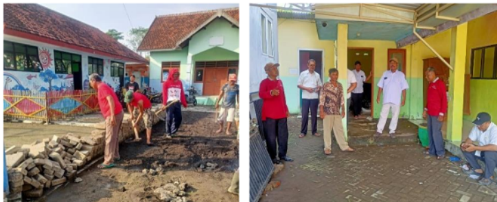
Gambar II: Proses Realisasi Pembangunan Gedung Sekolah TK