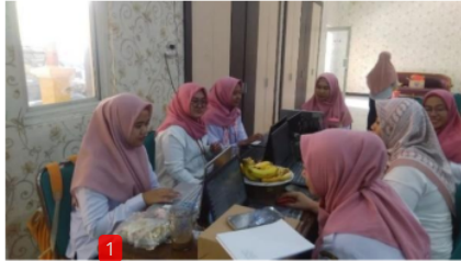
Gambar 3. Sosialisasi Aplikasi Sistem Pengelolaan Aset Desa (SIPADES)

bertanggungjawab untuk melakukan pembinaan terhadap pemerintah desa seluruh Kabupaten Sidoarjo termasuk Desa Dukuhsari. Berikut Foto kegiatan sosialisasi SIPADES yang telah diikuti oleh kaur TU dan Umum sekaligus operator aplikasi SIPADES Desa Dukuhsari: