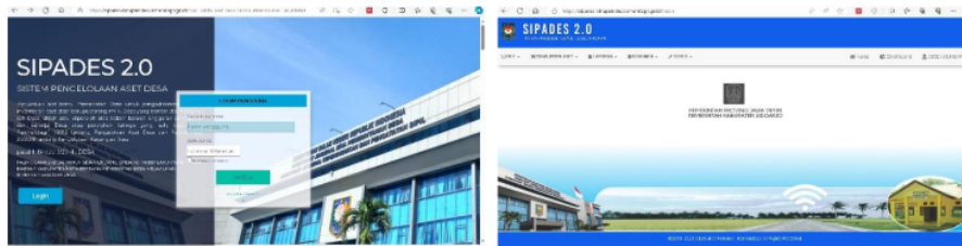
Gambar 1. Tampilan Aplikasi Sistem Pengelolaan Aset Desa (SIPADES)

Pada awalnya, aplikasi ini di 55 dalam versi 1.0, namun untuk menyempurnakan aplikasi SIPADES versi 1.0, pemerintah meformasi versi pada aplikasi pengelolaan aset desa menjadi SIPADES versi 2.0. Aplikasi SIPADES versi 2.0 adalah pelaksanaan dari aplikasi SIPADES versi 1.0 yang awalnya berbasis desktop hingga berbasis website (online) (Maarif et al., n.d.). SIPADES versi 1.0 dan versi 2.0 tidak banyak modifikasi diantara kedua versi tersebut, namun kualitas metode dan informasi aplikasi SIPADES versi 2.0 lebih baik jika dilihat dari penginputan dibandingkan aplikasi SIPADES versi 1.0. Penerapan SIPADES V 2.0 dilakukan pada tahun 2021 di seluruh Indonesia (Prayitno, 2021). Berikut adalah tampilan aplikasi SIPADES versi 2.0: