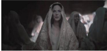
Gambar 5. Penduduk Fremen tunduk atas perintah Lady Jessica

pengambilan keputusan tergambarkan pada film Dune : Part Two yang terdapat pada scene berikut