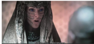
Gambar 2. Lady Jessica Kembali menggunakan kekuatan magisnya

Pada level ideologi, Scene ini seakan menyajikan eksistensi Lady Margo fenring sebagai anggota dari bene gesserit yang agung.