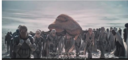
Gambar 6. Lady Jessica sedang memimpin perpindahan Fremen ke daerah selatan

Pada level ideologi, scene ini seakan menunjukkan eksistensi Lady Jessica sebagai Bunda suci bangsa Fremen yang baru.