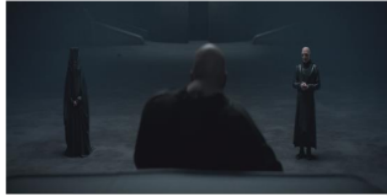
Gambar 3. Gaius Helen Mohiam berbicara pada Baron Vladimir

Feminisme dalam pengambilan keputusan menggarisbawahi pentingnya keterlibatan perempuan dalam semua tingkat proses pengambilan keputusan, baik dalam sektor publik maupun swasta. Berdasarkan penelitian oleh Van Zoonen (2020), keterlibatan perempuan dalam pengambilan keputusan tidak hanya memastikan bahwa perspektif perempuan diwakili, tetapi juga dapat meningkatkan kualitas dan inklusivitas dari keputusan yang diambil. Penelitian ini menunjukkan bahwa kehadiran perempuan dalam posisi pengambilan keputusan dapat mengarah pada kebijakan yang lebih adil dan responsif terhadap kebutuhan semua kelompok masyarakat. Kategorisasi ini berasal dari situasi perempuan borjois yang sudah menikah pada abad ke-18 yang tidak memiliki kebebasan dan tidak diizinkan untuk mengambil keputusan sendiri. Dan kemudian dari situlah timbul salah satu feminis, yaitu dengan tujuan untuk menyatakan bahwasannya semua manusia baik laki-laki ataupun perempuan berhak memperoleh hak yang setara. Feminisme dalam pengambilan keputusan tergambarkan pada film Dune : Part Two yang terdapat pada scene berikut