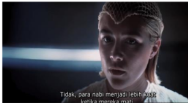
Gambar 4. Princess Irulan mengambil keputusan strategi penyerangan Fremen

Hal ini selaras dengan pernyataan paham feminis radikal, yaitu Daly dalam Tong (2004, p. 85) yang memiliki persepsi bahwa: "Perempuan akan mengakhiri permainan di mana laki-laki adalah tuan dan perempuan adalah budak, dengan menolak Pihak Lain dan memupuk kebutuhan, keinginan, dan kepentingan kita sendiri" dalam hal ini, liyan yang maksudkan adalah pandangan laki-laki yang secara kolektif menganggap perempuan sebagai benda ( it ) (Tong, 2004, p.84). setelah melihat shot ini peneliti simpulkan bahwasanya terdapat ketidak cocokan terhadap nilai feminis yang menjunjung kesetaraan seperti tujuan politik modern yang bis akita lihat sebagai yang paling dekat dengan feminis liberal. Mengapa demikian?, karena setelah peneliti melakukan analisis dari shot tersebut terdapat penukaran posisi Dimana perempuan menjadi atasan dan laki-laki sebagai bawahan.