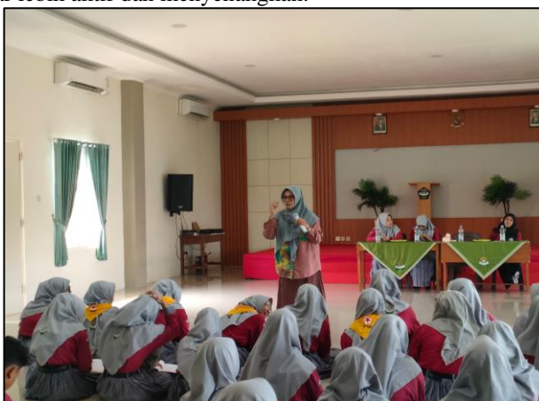
Gambar 2: kegiatan psikoedukasi

Kegiatan psikoedukasi yang dilaksanakan pada tanggal 2 Desember 2023, dimulai pukul 08.00–10.30 WIB. Awal kegiatan pada sesi pertama ini yaitu pembukaan yang dipandu oleh tim psikoedukasi yang bertujuan untuk membantu memahami apa-apa saja yang akan terjadi selama acara berlangsung serta menyampaikan pesan atau tujuan utama dari kegiatan psikoedukasi yang akan dilakukan pada peserta sehingga peserta akan siap dan mampu menerima materi yang disampaikan. Kegiatan selanjutnya ialah peserta diberikan soal Pre Test tentang Altruisme dan Dukungan Teman Sebaya, pengerjaan soal pre test ini dilaksanakan selama 15 menit. Pemberian soal Pre Test tersebut bertujuan untuk mengukur tingkat pemahaman siswa mengenai Altruisme dan Dukungan Teman Sebaya sebelum diadakan kegiatan psikoedukasi. Dalam penyampaiannya, tim psikoedukasi pada sesi ini menggunakan 2 metode pembelajaran interaktif yaitu ceramah dan diskusi seperti yang ditampilkan melalui LCD dengan paparan materi yang efektif dan profesional, serta mengajak langsung partisipan menambah pemahamannya terhadap pentingnya meningkatkan altruisme melalui dukungan teman sebaya. Media pembelajaran interaktif adalah media yang bisa menghasilkan interaksi atau tindakan aktif antara peserta didik dengan media yang disajikan (Mintorogo, Adib, 2014), karena media tersebut dapat membantu pemateri dalam memudahkan penyampaian informasi kepada peserta didik dan menjadikan proses belajar lebih aktif dan menyenangkan.