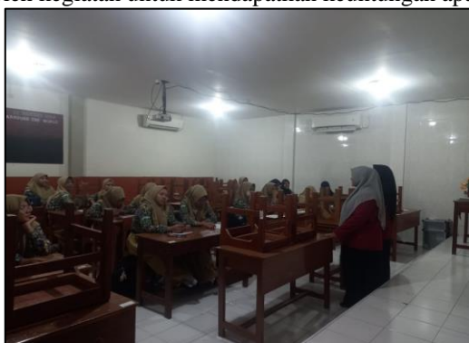
Gambar 1: kegiatan CNA

Berdasarkan hasil community need assessment (CNA) dengan menggunakan metode wawancara dan observasi pada anggota dan pembina PMR ini diperoleh data bahwa adanya kesenjangan pada sikap altruisme pada relawan Palang Merah Remaja (PMR) tersebut terkait dengan alasan awal ikut serta dalam ekstrakurikuler ini. Hal tersebut ditunjukkan melalui hasil survey awal yang telah dilakukan pada relawan Palang Merah Remaja di SMA Kemala Bhayangkari 3 Porong. Dari survey awal tersebut didapatkan hasil bahwa sebagian relawan Palang Merah Remaja di SMA Kemala Bhayangkari memiliki motivasi lain sebagai alasan bergabung dalam keanggotaan Palang Merah Remaja yang tidak sejalan dengan prinsip kesukarelaan dalam Palang Merah Remaja yakni kegiatan memberi bantuan secara sukarela yang tidak didasari oleh kegiatan untuk mendapatkan keuntungan apapun.