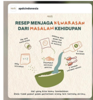
Gambar 1.1 Salah-satu postingan infografis di instagram @apdcindonesia

Pada periode analisis, @APDCIndonesia secara konsisten membagikan postingan yang informatif dan edukatif mengenai kesehatan mental. Postingan ini sering kali dilengkapi dengan infografis yang menarik, kutipan yang menggugah, dan panduan praktis untuk mengelola kesehatan mental. Konten visual yang kuat ini membantu menarik perhatian pengguna dan meningkatkan pemahaman mereka mengenai topik yang dibahas. Terlampir pada gambar 1.1 berikut :