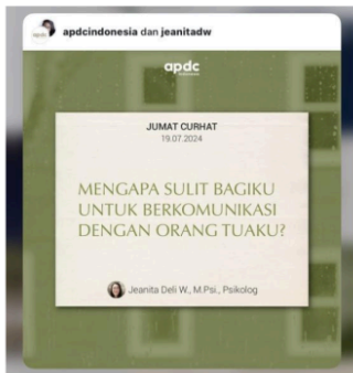
Gambar 1.3 Kolaborasi dengan Psikolog Terkemuka

@APDCIndonesia juga terlibat dalam kerjasama dengan influencer dan brand yang memiliki visi yang sejalan. Kolaborasi ini merupakan strategi yang sangat efektif untuk memperluas jangkauan kampanye dan memperkenalkan akun kepada audiens yang lebih luas. Dalam era digital saat ini, influencer memiliki pengaruh yang signifikan terhadap pengikut mereka, dan kerjasama dengan mereka memungkinkan @APDCIndonesia untuk menjangkau kelompok demografis yang mungkin sulit dijangkau melalui cara-cara konvensional. Seperti terlampir pada gambar :