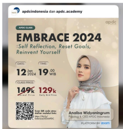
Gambar 1.4 Konsultasi di Platform ZOOM dari CEO APDC Indonesia

Selain kampanye digital yang aktif, @APDCIndonesia juga menyediakan layanan konsultasi yang komprehensif baik secara offline maupun online. Informasi mengenai layanan ini sering kali dibagikan melalui postingan dan highlight story di akun Instagram mereka, sehingga pengikut dapat dengan mudah mengetahui dan mengakses layanan tersebut. Pendekatan ini memungkinkan pengikut untuk mendapatkan dukungan yang lebih personal dan sesuai dengan kebutuhan mereka, yang sangat penting dalam konteks kesehatan mental.