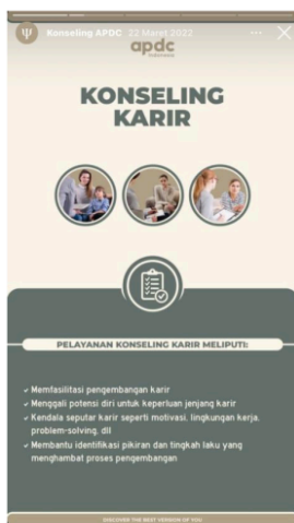
Gambar 1.2 Salah-satu Highlight Instastory bertajuk "Konseling APDC"

Highlight story di akun @APDCIndonesia berfungsi sebagai arsip yang mudah diakses oleh pengikut. Berbagai highlight story mencakup topik-topik seperti tips kesehatan mental, informasi tentang layanan konsultasi, dan testimoni dari individu yang telah mendapatkan manfaat dari layanan APDC. Penggunaan highlight story memungkinkan konten yang penting tetap terlihat dan dapat diakses kapan saja oleh pengguna. Seperti terlihat pada gambar dibawah :