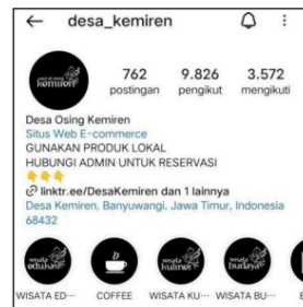
12 Gambar 1. Profil Akun Instagram @desa_kemiren

Akun Instagram @desa_kemiren pada pertengahan bulan maret memiliki jumlah followers sebanyak 9.826 dan memuat 762 postingan.