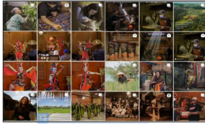
Gambar 2. Kumpulan Konten Instagram @desa_kemiren

Selain itu juga memberikan kemudahan akses, fasilitas, dan kelembagaan administrasi yang tertata dengan baik [4].