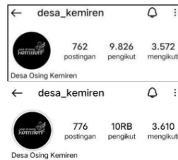
Gambar 3. Pengikut Akun Instagram @desa_kemiren