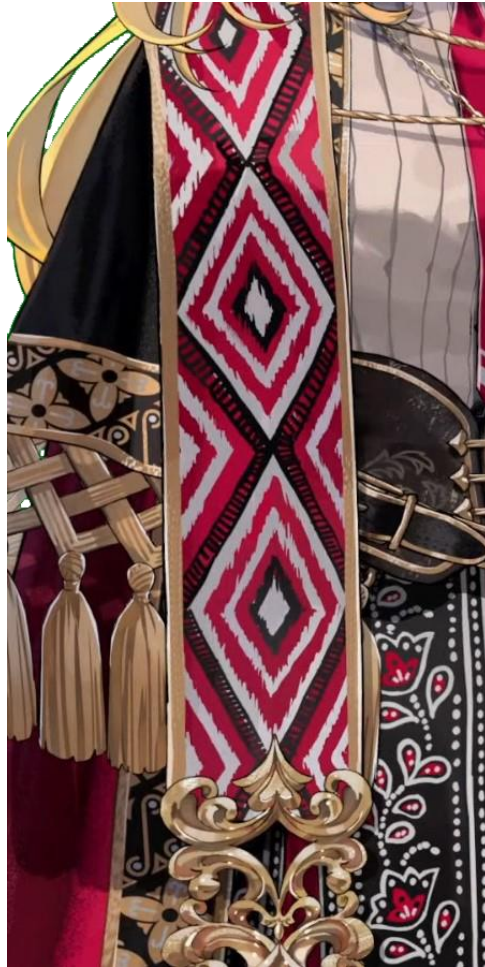
Gambar 7. Detail kain tenun dayak pada desain karakter Kaela.