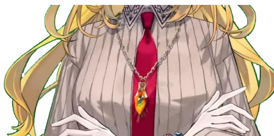
Gambar 5. Detail kalung pada desain karakter Kaela.

Penggunaan penanda gelang rotan dari Papua dalam desain karakter virtual Kaela Kovalskia juga dapat membuka peluang untuk kolaborasi dan pertukaran budaya yang lebih luas. Misalnya, melalui konten live streaming , pembuat konten dan audiens dapat terlibat dalam diskusi dan pertukaran tentang budaya Papua, memungkinkan pembelajaran dan pemahaman yang lebih baik tentang keanekaragaman budaya Indonesia.