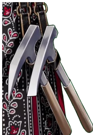
Gambar 8. Detail aksesoris palu pada desain karakter Kaela. (Sumber : (Kaela Kovalskia Ch. Hololive-ID, n.d.), Title : so, whats gonna be the theme? Durasi 25:48-26:03 menit)