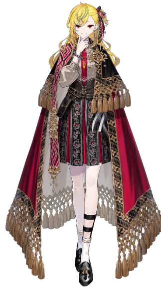
Gambar 2. Ilustrasi karakter Kaela Kovalskia.

Selain itu, teori Roland Barthes memberikan kerangka kerja yang kuat dalam memahami konvensi budaya yang mungkin mempengaruhi desain karakter. Konvensi budaya ini mencakup norma-norma, stereotip, dan asumsi yang diterima secara luas dalam masyarakat. Dalam desain karakter Kaela, dapat diidentifikasi konvensi budaya yang tercermin dalam atribut atau penampilan karakter tersebut. Misalnya, penampilan karakter dengan aksesoris dan pakaian tradisional dapat mencerminkan konvensi gaya nusantara atau tema budaya yang baru dalam ranah virtual youtuber.