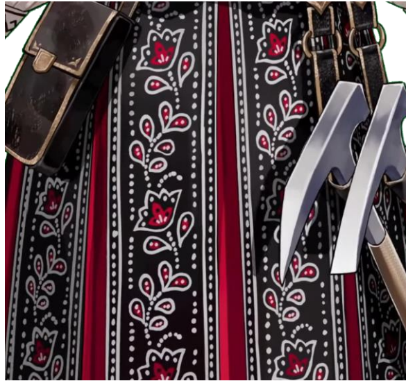
Gambar 6. Detail campuran kain batik lasem dan batik sekarjati pada desain karakter Kaela.