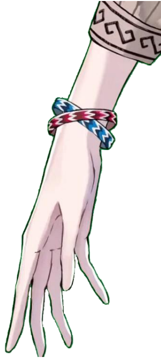
Gambar 4. Detail gelang pada desain karakter Kaela. (Sumber : (Kaela Kovalskia Ch. Hololive-ID, n.d.), Title : so, whats gonna be the theme? Durasi 28:00-28:16 menit).