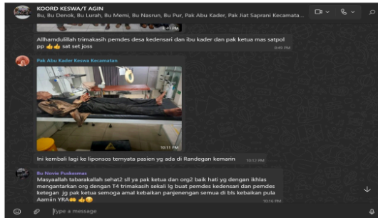
Gambar 2. Grup Koordinasi Kesehatan Jiwa kecamatan Tanggulangin sebagai sarana koordinasi antar stakeholder

Namun, ketika informasi telah dibuat berupa file surat undangan, tidak jarang kader Kesehatan Jiwa tidak membagikannya kepada penerima layanan atau pasien, sehingga pelaksanaan Posyandu Jiwa menjadi tidak optimal dan berdampak pada rendahnya tingkat kehadiran. Dari segi alur informasi, koordinasi telah terjalin melalui paguyuban kader keswa tingkat kecamatan antara pihak Puskesmas dan kecamatan dengan kader Kesehatan Jiwa di seluruh desa yang ada di kecamatan Tanggulangin termasuk desa Kalitengah.