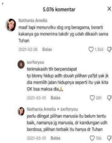
Gambar 5: Kolom komentar akun TikTok Ian Hugen

Tangkapan layar diambil pada 30 April 2024. Video diatas mengandung pro dan kontra, salah satunya komentar diatas. Nathania Amelia berkomentar jika, "maaf tapi menurutku sbg org beragama, berarti kakanya ga menerima takdir yang sudah dikasi sama tuhan" . Komentar tersebut di likes sebanyak 1.365 orang. sxforyou membalas komentar Nathania Amelia yang mengatakan jika, "terimakasih tih berpendapat tp bknny hidup adlh sebuah pilihan ya? jd ya jd dia memilik jalan hidupnya seperti itu yak kita gak bisa maksa dia" . Tentunya apa yang kita anggap benar belum tentu orang lain anggap benar, tetapi dengan @ianhugen perlahan membuka pemikiran orang lain jika tidak selamanya transgender adalah sesuatu hal yang buruk. ianhugen adalah salah satu transgender yang banyak disukai oleh netizen TikTok. Karna yang dilihat dari ianhugen adalah seorang transgender yang memiliki banyak kemampuan, yang fokus pada karirnya, cantik, serta memiliki badan ideal meskipun ianhugen adalah seorang transgender. Maka dari itu dengan karya yang dimiliki ianhugen bisa membuktikan jika transgender tidak boleh dipandang sebelah mata.