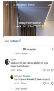
Gambar 2: Kolom komentar akun TikTok Ian Hugen

Pada salah satu konten video @ianhugen menyebutkan " transgender tapi kok cantik dan pintar??? " salah satu followers akun chill berkomentar " tapi bener loh, cara ngomong kakak tuh enak banget buat di denger ". Salah satu komentar followers @ianhugen dengan likes terbanyak, sebanyak 2.058. @ianhugen membalas komentar tersebut dengan membalas " kan penyiar radio kakkk, thanku anyway! ". Komentar tersebut ditulis oleh followers @ianhugen pada 24 februari 2024. Tentu selain menjadi seleb di TikTok @ianhugen juga menjadi seorang penyiar radio sehingga meskipun seorang transgender @ianhugennempunyai suara khas perempuan pada umumnya.