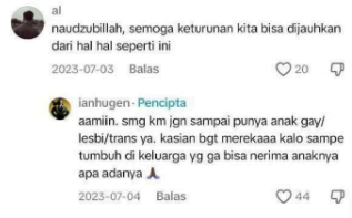
Gambar 14: Kolom komentar akun TikTok Ian Hugen

komentar ini diambil pada tanggal 30 April 2024. Menurut warganet salah satu video terdapat komentar al yang mengatakan ‘naudzubillah, semoga keturunan kita bisa dijauhkan dari hal hal seperti ini’ . Komentar ini disukai oleh 20 orang dan ian langsung membalas komentar tersebut dengan menjawab ‘aamiin. Smg km jgn sampai punya anak gay/lesbi/trans ya. kasian bgt merekaa kalo sampe tumbuh di keluarga yg ga bisa nerima anaknya apa adanya’ . Balasan komentar @ianhugen telah disukai oleh 44 orang. komentar komentar negatif seperti diatas selalu mengarah ke agama karena, di Indonesia mayoritas adalah agama islam. Sehingga banyak orang yang beranggapan jika seseorang yang memutuskan menjadi seorang transgender adalah sesuatu hal yang haram, buruk, bahkan menyimpang agama, budaya, maupun adat. Dan pada saat ini fenomena transgender menimbulkan rasa cemas pada masyarakat luas akibat kemungkinan legalisasi perkawinan sejenis.