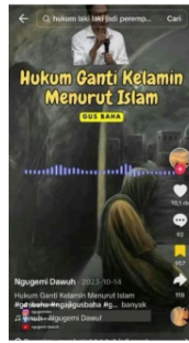
Gambar 17: Hukum Ganti Kelamin Menurut Islam

Dalam video tersebut Gus Baha yakni seorang Ulama mengatakan jika, “transgender adalah hak asasi, tapi kenapa dilarang dalam islam? Sekarang putuskan jika sudah ganti kelamin lalu tidurnya dengan siapa, seumpama ditaruh pesantren putra atau pesantren putri, terus kalau sholat dengan cara apa, apa dia tetap perempuan atau tetap laki-laki, kalau dia kawin mau dengan siapa, coba sekarang diputuskan jika dia menjadi perempuan sholatnya itu ala perempuan atau laki-laki.”