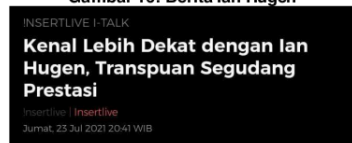
Gambar 16: Berita Ian Hugen

Berita ini rilis pada tanggal 23 juli 2021. Isi pada berita yang ada didalamnya yaitu mengenai perjalanan ianhugen yang memulai membuat konten di TikTok dengan mereview kos-kosan yang ada di jakarta dengan harga selangit, lalu membuat konten yang mengangkat cerita atau isu yang relate dengankehidupan. Tentu perjalanannya tidak semulus yang dibayangkan, banyak rintangan yang ianhugen lalui, seperti mendapatkan deskriminasi, tidak mendapatkan hak yang sesuai pada umumnya. Hingga kini, ianhugen telah membuktikan semuanya dan memiliki banyak fans. Kini ianhugen menjadi seleb TikTok dengan pengikut ratusan ribu dan memiliki banyak pekerjaan seperti mereview makeup, maupun baju perempuan yang menjadikan ianhugen sebagai modelnya.