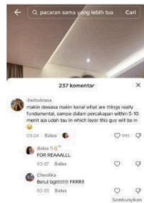
Gambar 6: Kolom komentar akun TikTok Ian Hugen

Komentar tersebut diambil pada tanggal 6 April 2024 pada akun TikTok @ianhugen. Komentar tersebut menampilkan komentar follower yang Disukai oleh ianhugen, yang dimana isi dalam video tersebut menceritakan pengalamian ianhugen dekat dengan pasangannya yang lebih tua. Lalu followers ianhugen dengan nama akun ihuubiasa mengatakan jika, "makin dewasa makin kenal what are really fundamental, sampe dalam percakapan within 5-10 menit aja udah tau in which layer this guy will be in" . Komentar tersebut disukai oleh ianhugen dan disukai oleh akun lain sebanyak 993.