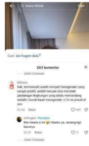
Gambar 3: Kolom komentar akun TikTok Ian Hugen

Komentar kedua ditulis pada tanggal 6 februari 2024. Pada salah satu video @ianhugen yang mengenai transgender, followers @ianhugen dengan akun Ggreen berkomentar “ kak, terimakasih sudah menjadi transgender yang sangat positif, sedikit banyak bisa merubah pandangan lingkungan yang selalu memandang rendah / buruk kaum transgender :) i'm so proud of you ”. Komentar tersebut di likes oleh followers lain sebanyak 499 likes dan di tanggapi oleh @ianhugen dan di balas “ this means a lot! Thanku ya, senang bgt bacanya ”. Tanggapan @ianhugen mendapatkan likes sebanyak 77 followers. Komentar followers diatas bermaksud berterimakasih kepada @ianhugen karena telah menjadi seorang transgender yang memiliki positive vibes yang sedikit banyak bisa merubah pandangan orang lain mengenai transgender.