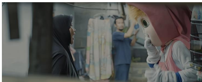
0.21-0.45/14.57 – Scene 1