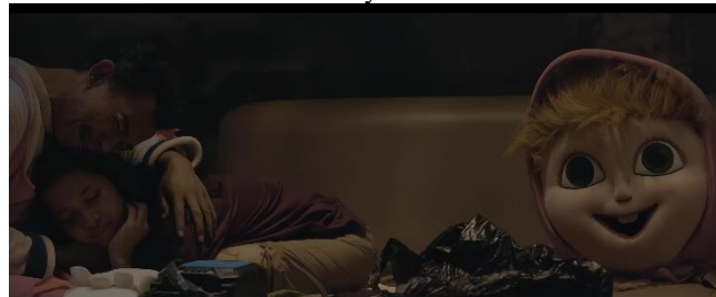
Gambar 13. Pemeran anak memeluk pemeran ayah.