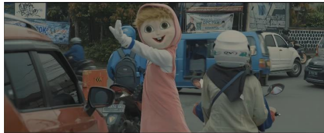
2.20-3.01/14.57 – Scene 2

Mitos yang terdapat pada scene ini adalah tentang asumsi perempuan tersebut yang mengatakan bahwa anak jika tidak dididik oleh ibunya maka anak tersebut tidak akan memiliki akhlak yang baik. Seorang ibu memang memiliki peran penting dalam pertumbuhan sang anak. Tanpa adanya sosok ibu maka anak akan merasa sepi dan merasa kekurangan kasih sayang yang sempurna dari orang tuanya. Selain itu peran ibu juga sangat penting dalam pembentukan karakter dan akhlak anak. Namun, hal tersebut tidak sepenuhnya benar, meskipun sangat berpengaruh. Ketika seorang anak sejak kecil sudah ditinggalkan oleh ibunya, bukan berarti anak tersebut akan tumbuh dengan akhlak yang buruk, karena pada dasarnya akhlak dapat dibentuk dari lingkungan anak tersebut, jika lingkungan tempat anak tinggal merupakan lingkungan yang positif, maka kemungkinan besar anak tersebut akan tumbuh dengan akhlak yang baik. Faktor keturunan secara langsung ataupun tidak langsung juga akan berpengaruh pada pembentukan akhlak anak. Selain itu akhlak juga dapat dibentuk dari dunia pendidikan, terutama pada saat anak tersebut masih balita. Namun, peran orang tua juga sangat penting karena orang tua yang menjadi madrasah pertama anak saat masih balita. Oleh karena itu, peran orang tua baik ayah ataupun ibu sangat berpengaruh terhadap pembentukan karakter dan akhlak sang anak. Dalam scene pertama ini merepresentasikan peran orang tua pada pembentukan akhlak anak.