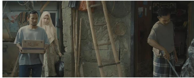
4.12-4.29/14.57 – Adegan 4