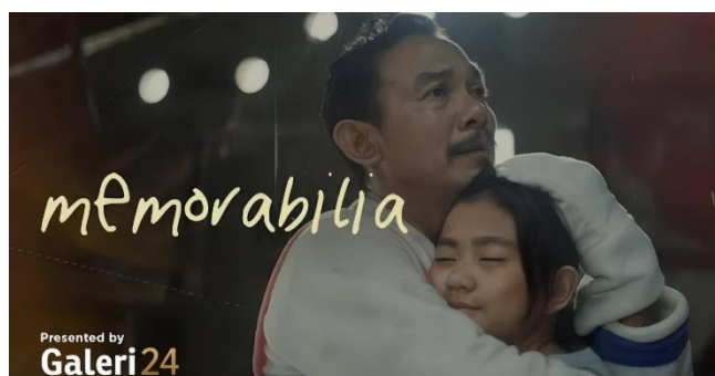
Gambar 1. Poster film Memorabilia

Di era saat ini youtube digunakan sebagai media untuk mendapatkan informasi, hiburan, serta unruk berinteraksi di dunia entertainment. salah satu contoh video yang ada di YouTube adalah film pendek Memorabilia..