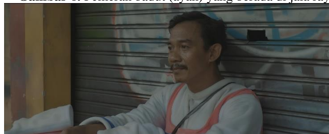
Gambar 7. Pemeran ayah yang sedang duduk