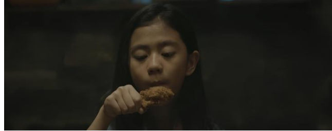
3.49-4.12/14.57 – Adegan 3

mengamen merupakan suatu aktivitas mengemis karena dianggap meminta-minta pada orang lain. Hal tersebut dilakukan karena sulitnya mencari pekerjaan di negara ini. Selain itu persyaratan-persyaratan yang sulit dipenuhi menjadi salah satu faktor sulitnya mencari pekerjaan. Akan tetapi terdapat kemungkinan tentang kualitas diri sang ayah yang tidak maksimal, sehingga menyulitkannya dalam mendapatkan pekerjaan yang lebih layak. Oleh karena itu, sang ayah terpaksa menjadi badut (pengamen) untuk mencari uang sebagai bentuk tanggung jawab orang tua terhadap anak dalam menafkahi serta memenuhi kebutuhan yang dibutuhkan setiap anak. Jika sang ayah (badut) tidak mengamen, maka dia tidak dapat menafkahi anaknya.