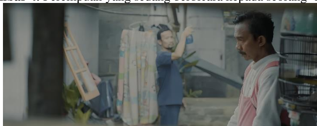
Gambar 5. Wajah pemeran ayah (badut)