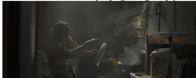
Gambar 11. Pemeran ayah yang sedang memasak.