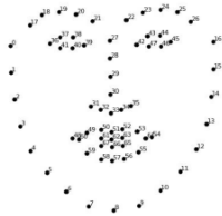
Gambar 2. Ilustrasi Shape Predictor_68_Facial Landmark

Tahap terakhir yakni outputan dari sistem terdiri dari 2 komponen. Komponen pertama ouputan audio speaker terhubung dengan Raspberry Pi 4 model B melalui port audio diameter 3.5 mm. Komponen kedua yakni I2C OLED 128x64 koomponen menampilkan karakter melalui layar OLED dengan layar grafis yang memiliki 128 kolom dan 64 baris, terhubung dengan pin GPIO ( General Purpose Input Output ) melalui komunikasi I2C yang tersedia pada Raspberry Pi 4 model B [10].