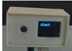
Gambar 13. OLED Menampilkan "Alert"

Gambar 11. dan Gambar 12. merupakan tampilan hasil video real-time, terlihat bahwa sistem dapat mendeteksi jarak vertikal mata dan jarak horizontal mata. Nilai EAR untuk kedua mata dihitung berdasarkan persamaan (1), kemudian nilai EAR dari kedua mata ditampilkan dalam frame. Berdasarkan gambar 12. selama mata tertutup, nilai EAR mendekati nilai 0, ketika mata terbuka nilai EAR dapat dikatakan lebih besar dari nilai 0. Pada gambar. terlihat bahwa nilai EAR yang muncul pada frame pada gambar sebesar 0.28 pada kondisi mata terbuka (tidak mengantuk) sehingga sistem pada alat tidak akan memberikan peringatan. Gambar 12. menunjukkan nilai EAR sebesar 0.19 pada kondisi mata tertutup (mengantuk) pada frame akan merespon untuk menampilkan kalimat peringatan. Sedangkan pada Gambar 12. merupakan respon dari I2C OLED 128x64 jika nilai EAR dibawah ambang batas 0.22 akan menampilkan kalimat "Alert", dan juga akan memberikan peringatan suara melalui audio speaker.