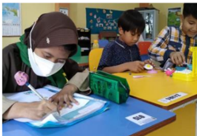
Gambar 6. Penataan tempat duduk responsif gender