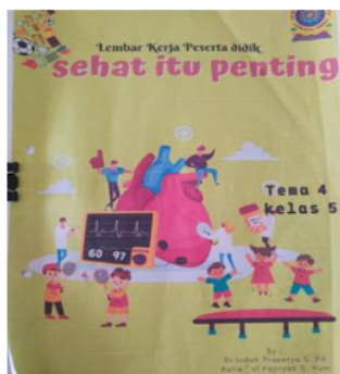
Gambar 2. Sampul Lembar kerja peserta didik

Temuan kedua dalam penelitian ini berkaitan dengan indikator integrasi gender dalam bahan ajar. Materi pembelajaran yang dipelajari oleh peserta didik SD Muhammadiyah 1 Candi Labschool Umsida berasal dari bahan ajar lembar kerja peserta didik atau LKPD. Lembar kerja dibuat oleh guru dengan mempertimbangkan unsur kesetaraan gender didalamnya. Muatan materi dan gambar yang terdapat didalam LKPD sangat diperhatikan oleh guru guna menghindari adanya bias gender pada bahan ajar. Gambar 2 menunjukkan halaman sampul LKPD yang dibuat oleh guru menunjukkan aktivitas laki-laki dan perempuan yang sedang melakukan kegiatan yang sama. Selain itu, pada Gambar 3 menunjukkan contoh gambar dari materi seni budaya dan prakarya tentang tarian tradisional. Dalam lembar kerja tersebut, terdapat penari laki-laki dan perempuan. Disini guru ingin menunjukkan bahwa profesi atau kegiatan tari tidak hanya dapat dilakukan oleh salah satu jenis kelamin saja, akan tetapi laki-laki dan perempuan memiliki kesempatan yang sama dalam melakukan hal tersebut tanpa adanya dominasi oleh salah satu gender. Sebagian gambar yang terdapat dalam lembar kerja berasal dari dokumentasi kegiatan pembelajaran peserta didik. Harapan dengan adanya gambar tersebut peserta didik dapat dengan mudah dalam memahami materi dan mengerjakan soal yang ada di LKPD karena telah mendapatkan pengalaman pembelajaran secara langsung.