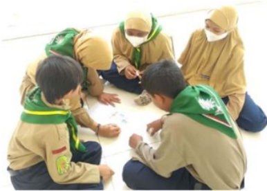
Gambar 4. Pembelajaran kooperatif

Pembelajaran tematik responsif gender juga terlihat dalam kegiatan pembelajaran mengolah makanan sehat. Melalui hidden kurikulum responsif gender, guru melakukan pengembangan dalam proses pembelajaran dengan mengadakan kegiatan memasak. Seluruh peserta didik diminta untuk membawa bahan makanan secara acak untuk diolah menjadi makanan sehat di sekolah. Gambar 5 menunjukkan bahwa dalam kegiatan memasak, seluruh peserta didik laki-laki dan perempuan seluruhnya terlibat dan aktif dalam mengolah bahan makanan. Melalui pembelajaran ini guru ingin menunjukkan bahwa memasak adalah kegiatan yang menyenangkan dan tidak hanya dilakukan oleh perempuan saja, akan tetapi laki-laki juga dapat melakukan kegiatan tersebut. Keterampilan yang didapat dalam kegiatan ini diantaranya peserta didik dapat memilih, mengolah, dan mengetahui fungsi makanan sehat bagi tubuh.