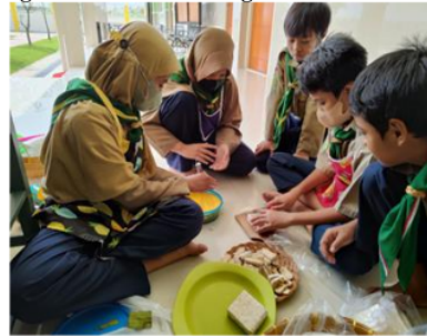
Gambar 5. Pembelajaran responsif gender mengolah makanan sehat

Temuan penelitian selanjutnya berkaitan dengan indikator pengelolaan kelas responsif gender. Pengelolaan kelas yang dilakukan oleh guru juga terlihat dalam Gambar 6 menunjukkan posisi duduk peserta didik yang heterogen, dimana peserta didik laki-laki dan perempuan berdampingan dalam proses pembelajaran. Peserta didik diberikan kebebasan untuk memilih tempat duduk yang nyaman bagi mereka tanpa terkecuali anak berkebutuhan khusus. Dalam 3 melakukan pengelolaan kelas guru membentuk sebuah struktural atau pengurus didalam kelas. Di kelas V ini guru memberikan kesempatan kepada seluruh peserta didik untuk mencalonkan diri sebagai pengurus kelas. Peserta didik yang mencalonkan diri sebagai pengurus kelas menjalani serangkaian tes terkait tanggung jawab, kedisiplinan, kerja keras, kejujuran, dan kemampuan untuk mengayomi temannya. Pelaksanaan tes dilakukan selama satu minggu baik didalam maupun diluar proses pembelajaran. Peserta didik lainnya bertugas untuk memberikan penilaian terhadap kinerja para calon. Setelah masa tes selesai, guru mengajak peserta didik untuk bermusyawarah dalam menentukan pengurus kelas. Proses pemungutan suara dilakukan dengan cara voting. Hasil dari pemungutan suara menentukan siapa yang layak menjadi pengurus kelas ditinjau dari tanggung jawab dan aspek lainnya. Gambar 7 menunjukkan bahwa menteri koordinator yang bertugas sebagai ketua kelas dijabat oleh peserta didik perempuan dan juga terlihat menteri keuangan dijabat oleh laki-laki.