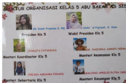
Gambar 7. Struktur pengurus kelas V

Penilaian yang dilakukan oleh guru kelas V SD Muhammadiyah 1 Candi Labschool Umsida bersifat adil dan objektif. Proses penilaian yang responsif gender dalam kegiatan pembelajaran dilakukan guru dengan memberikan kesempatan yang sama kepada seluruh peserta didik untuk bertanya dan menjawab pertanyaan yang diberikan oleh guru atau sesama teman sebagai nilai keaktifan. Penilaian juga dilakukan secara rutin pada akhir pembelajaran tematik atau pergantian tema. Seluruh peserta didik mendapat kesempatan yang sama untuk mengikuti proses penilaian. Apabila terdapat peserta didik yang berhalangan hadir saat penilaian, maka peserta didik tersebut akan mendapatkan kesempatan mengikuti penilaian dihari lain dengan soal yang sama dengan peserta didik lainnya. Soal yang dibuat oleh guru terdiri dari dua macam, yakni soal untuk anak reguler dan soal untuk anak berkebutuhan khusus. Perbedaan jenis soal tersebut disesuaikan dengan karakteristik dan kemampuan belajar peserta didik.