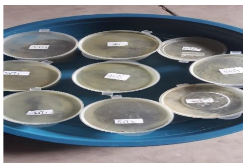
Gambar 2. Tepung Daun Kelor (Dokumen Pribadi)