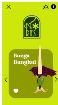
Gambar 6. Main menu