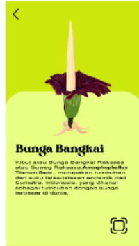
Gambar 7. Isi materi