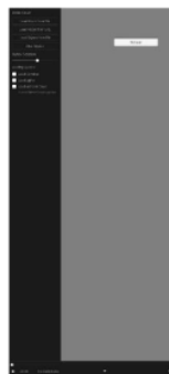
Gambar 8. Import

Halaman import dimana user dapat menginputkan model 3D objek dari perangkat smartphone yang kemudian akan ditampilkan selain itu pada halaman import terdapat tombol keluar dari halaman tersebut