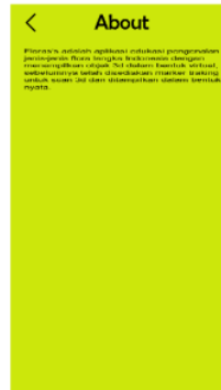
Gambar 9. About

Halaman about menampilkan text mengenai aplikasi dan tujuan dibuatnya aplikasi. Selain itu terdapat tombol back untuk kembali pada halaman main menu.