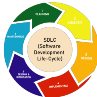
Gambar 1. Metode SDLC

Pada penelitian ini menggunakan metode SDLC (Software Development Life Cycle) untuk membangun sebuah aplikasi. SDLC merupakan metode sebuah system perangkat lunak ang dibangun atau dipelihara [9]. Metode ini memiliki peran penting dalam mengembangkan system dan aplikasi untuk menjamin pengelolaan yang kuat dan memaksimalkan produktifitas. Adapun tahap-tahap pembangunan secara umum diantaranya planning, analysys, design, implementation, testing dan maintenance [10].