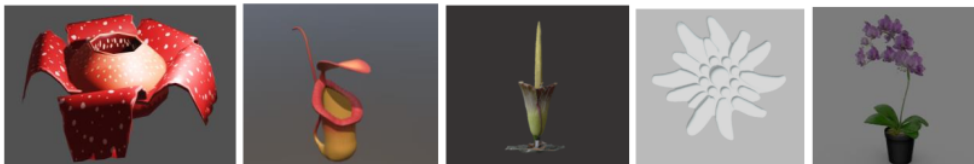
Gambar 4. Model 3D objek

Pada penelitian ini terdapat model 3D objek yang akan ditampilkan dalam bentuk Augmented Reality setelah melakukan tracking marker. Model 3D objek terdiri dari beberapa jenis flora, diantaranya rafflesia arnoldii, bunga bangkai, kantong semar, anggrek hitam dan bunga edelweisse yang dibuat menggunakan software blender.