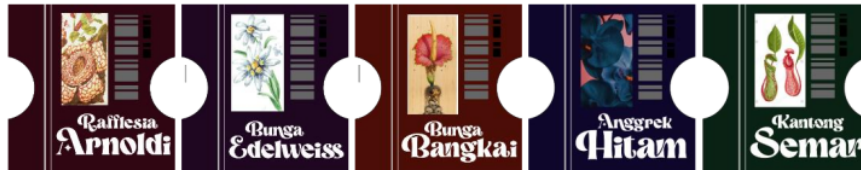
Gambar 3. Marker

pada penelitian ini terdapat marker yang digunakan untuk tracking atau deteksi. Marker merupakan gambar penanda objek dimana digunakan untuk tracking atau deteksi melalui media kamera maupun webcam pada perangkat mobile/smartphone yang akan menampilkan model 3D objek dalam bentuk Augmented Reality secara realtime.