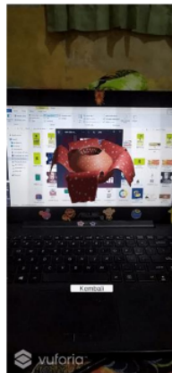
Gambar 8. Scan 3D objek

Halaman scan 3D objek dimana aplikasi akan memproses dengan menampilkan kamera atau webcam yang digunakan untuk deteksi marker yang menampilkan model 3D objek dalam bentuk augmented reality. Dan terdapat tombol kembali untuk kembali ke main menu.