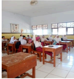
Gmabar 1. Antusias siswa

Pada kegiatan pertama, guru merencanakan dan mempersiapkan seluruh aspek yang diperlukan untuk menerapkan metode kuis interaktif. Rencana ini mencakup penyusunan materi kuis yang sesuai dengan topik pelajaran, yaitu hal-hal yang membatalkan salat, serta pembuatan pertanyaan yang beragam untuk menguji pemahaman siswa. Selain itu, guru juga mempersiapkan alat bantu pembelajaran seperti soal-soal dan skor. Guru melakukan observasi awal untuk mengetahui tingkat pemahaman siswa terhadap materi yang akan diajarkan dan juga mengidentifikasi motivasi belajar mereka. Berdasarkan observasi ini, guru memutuskan untuk memberikan motivasi tambahan, termasuk menjelaskan manfaat dari metode kuis interaktif untuk meningkatkan pemahaman siswa dan membuat pembelajaran lebih menyenangkan. Guru juga menyiapkan teknik untuk meningkatkan keterlibatan siswa, seperti memberi kesempatan kepada mereka untuk berdiskusi dalam kelompok dan memberikan penghargaan untuk partisipasi aktif.[14]