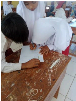
Gambar 2. Pengisian Quis

Pada kegiatan pertama, guru merencanakan dan mempersiapkan seluruh aspek yang diperlukan untuk menerapkan metode kuis interaktif. Rencana ini mencakup penyusunan materi kuis yang sesuai dengan topik pelajaran, yaitu hal-hal yang membatalkan salat, serta pembuatan pertanyaan yang beragam untuk menguji pemahaman siswa. Selain itu, guru juga mempersiapkan alat bantu pembelajaran seperti soal-soal dan skor. Guru melakukan observasi awal untuk mengetahui tingkat pemahaman siswa terhadap materi yang akan diajarkan dan juga mengidentifikasi motivasi belajar mereka. Berdasarkan observasi ini, guru memutuskan untuk memberikan motivasi tambahan, termasuk menjelaskan manfaat dari metode kuis interaktif untuk meningkatkan pemahaman siswa dan membuat pembelajaran lebih menyenangkan. Guru juga menyiapkan teknik untuk meningkatkan keterlibatan siswa, seperti memberi kesempatan kepada mereka untuk berdiskusi dalam kelompok dan memberikan penghargaan untuk partisipasi aktif.[14]