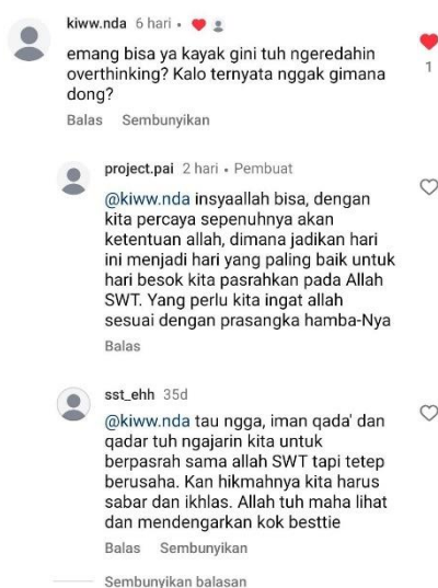
Gambar 2. Interaktif siswa dan peneliti