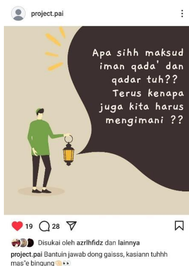
Gambar 1. Contoh postingan interaktif pada feeds Instagram

Penggunaan feeds Instagram digunakan sebagai media pembelajaran seputar materi iman qada' dan qadar. Adapun Langkah dalam penggunaan feeds Instagram sebagai media pembelajaran diantaranya: 1) Pengguna mendesain postingan yang dapat menarik followers untuk berinteraktif di kolom komentar, 2) Pengguna mengajukan pertanyaan secara khusus terkait iman qada' dan qadar kepada followers, 3) Penggunaan bahasa yang lebih mudah untuk siswa pahami atau dengan bahasa non formal. Dimana hal ini bertujuan sebagai penyampaian materi iman qada' dan qadar yang baik kepada followers. Misalnya, peneliti ingin menguji pemahaman siswa terkait iman qada' dan qadar, maka peneliti dapat mengajukan pertanyaan seperti, " Apa maksud dari iman qada' dan qadar dan mengapa kita harus mengimani?" dan siswa dapat menjawab atau menanggapiya melalui kolom komentar. Apabila siswa menjawab dengan benar maka, peneliti dapat memberikan simbol sebagai tanda bahwa jawaban yang diberikan siswa tepat.