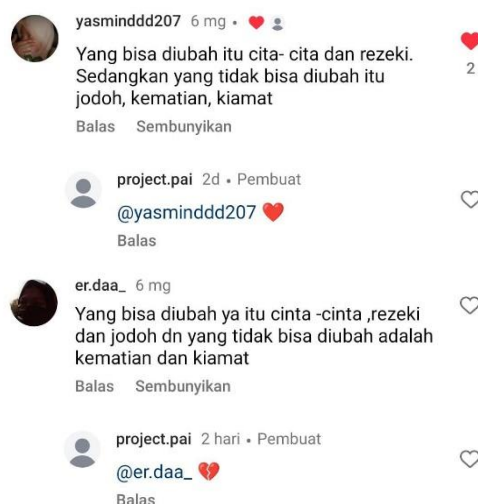
Gambar 4. Hasil jawaban siswa

Dari hasil penelitian yang telah diuji cobakan melalui feeds dan kolom komentar Instagram ini, peneliti menemukan bahwa masih ada siswa yang belum memahami iman qada' dan qadar dengan baik.