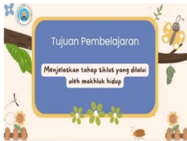
Gambar 2. Hasil pengembangan media pembelajaran berbasis digital video pembelajaran

Ketiga, guru mengembangkan e-modul menggunakan canva dan anyflip. Berdasarkan wawancara yang dilakukan peneliti, kelebihan e-modul dapat meningkatkan pemahaman materi siswa dengan baik, tujuan pembelajaran menjadi lebih jelas dan terarah, serta e-modul ini lebih menarik karena dapat dilengkapi dengan fasilitas multimedia seperti gambar, animasi, audio, dan video melalui scan barcode. Hal ini relevan dengan pendapat Hidayati, dkk (2022) E-modul memiliki kelebihan dibandingkan dengan modul cetak karena sifatnya yang interaktif memudahkan dalam navigasi, memungkinkan menampilkan atau memuat gambar, audio, video, dan animasi serta dilengkapi tes atau kuis formatif yang memungkinkan umpan balik otomatis dengan segera (Hidayati Azkiya et al., 2022). Cara guru MI Muhammadiyah 2 Sidoarjo mengembangkan e modul flipbook yaitu mencari dari referensi beberapa buku, terutama di buku di Kemendikbud, beberapa buku dari Airlangga, Yudistira dan membuat sesuai dengan CP dan TP yang ada di modul yang sudah diberikan oleh pemerintah. Selanjutnya guru mengembangkan flipbook di canva dengan fitur-fitur yang sudah disediakan dan desain kemudian guru. Kemudian e-book di download dalam bentuk pdf. Setelah itu guru dapat memasukkan file ke aplikasi Anyflip atau bisa mengakses di web https://www.fliphtml5.com . Dengan