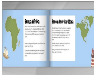
Gambar 3. Hasil pengembangan media pembelajaran berbasis digital e-book

langkah-langkah diatas flipbook dapat diimplementasikan ke siswa. Berikut contoh hasil e-book flipbook yang sudah dikembangkan guru.