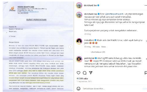
Gambar 6 surat pernyataan produk Helwa Beauty milik kartika putri

Terlihat pada gambar 1 Dr Richard Lee menampilkan bukti atau surat pernyataan yang ditujukan untuk kartika putri, Ia juga memberi komentar pada unggahannya yakni: