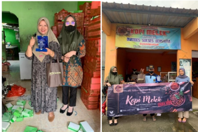
Gambar 6. Penyerahan Hampers dan Kenang-Kenangan kepada I'in Bakery dan Kopi Melek