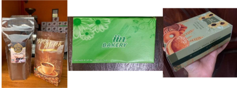
Gambar 5. Tampak Packaging Lama dan Baru