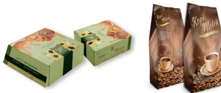
Gambar 4. Desain Mockup Packaging "I'in Bakery" dan "Kopi Melek"

Setelah itu tim juga membantu untuk merebranding desain packaging produk "Kopi Melek" dan "I'in Bakery" agar menjadi lebih memiliki nilai jual dan menarik minat beli konsumen, karena desain kemasan lama mereka terbilang masih sangat sederhana. Desain packaging untuk "Kopi Melek" dan "I'in Bakery" menggunakan desain visual yang kekinian terdapat pada Gambar 4. Warna coklat ditambah desain tulisan berwarna keemasan pada desain kemasannya menambah kesan elegan, serta terdapat animasi gunung, biji kopi dan segelas kopi menandakan biji kopi yang di produksi oleh "Kopi Melek" ini 100% berasal dari pegunungan. Lalu pada desain packaging "I'in Bakery" didominasi warna hijau memberikan efek yang bagus menandakan kesegaran daripada produk yang mereka jual, sedangkan animasi bunga matahari yang ditambahkan merupakan simbol kegembiraan atau pikiran positif yang ditujukan kepada para konsumennya dan animasi kue-kuean yang menggambarkan bahwa home industry ini memproduksi kue. Gambar 5 merupakan gambar dari packaging kedua home industry sebelumnya dan perubahan setelah di rebranding desain.