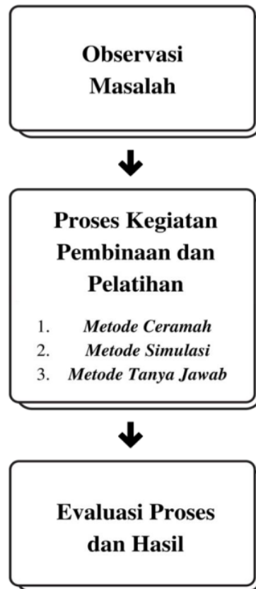
Gambar 1. Skema Kegiatan