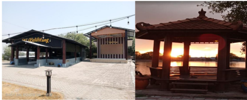
Gambar 3. Café Kalitikung Selesai Pengerjaan dan Gazebo