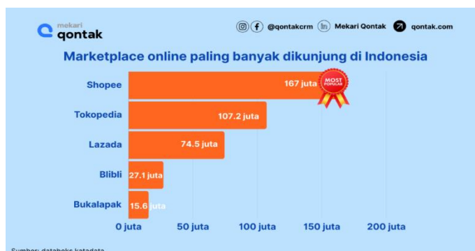
Gambar 1 diagram marketplace pilihan masyarakat

pada Shopee itu sendiri [5]. Shopee juga dapat dipercaya guna memenuhi kebutuhan masyarakat karena Shopee menyediakan berbagai macam kebutuhan baik kebutuhan kecantikan, fashion, makanan, peralatan olahraga dan berbagai peralatan ibu rumah tangga [6]. Sehingga Shopee menerapkan berbagai strategi guna mempromosikan apa yang telah dipasarkan dan hasil dari perkembangan strategi yang diterapkan, Shopee tersebut pada tahun 2018-2020 berada di posisi top brand. Adanya pengenalan ekuitas berbasis pelanggan dalam memasarkan produk bertujuan untuk mengembangkan merek yang kuat dalam pemasaran. Menurut gagasan ini, ekuitas merek dapat dianggap sebagai pengetahuan merek, yang terdiri dari dua bagian kesadaran merek dan citra merek. Sehingga dapat membangun perusahaan akan lebih sederhana dengan ekuitas merek yang tinggi.