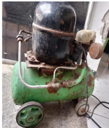
Gambar 2. Kompresor