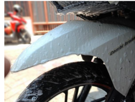
Gambar 6. Spakbor dengan tekanan 30 Psi

Uji penyemprotan sabun pada spakbor ini dilakukan untuk melihat efektivitas sabun dalam mengangkat kotoran dari permukaan spakbor, yang merupakan bagian kendaraan yang sering terpapar debu dan noda. Efektivitas pembersihan sabun dapat membantu melunakkan dan mengangkat kotoran, sehingga membuat proses pembersihan menjadi lebih efisien dan tidak memerlukan usaha yang berlebihan. Kotoran yang lebih mudah terangkat menunjukkan efektivitas sabun yang baik dan tekanan yang cukup, yang pada gilirannya mencerminkan kualitas sabun serta teknik penyemprotan yang digunakan. Dengan demikian, uji ini tidak hanya penting untuk menilai kemampuan sabun, tetapi juga memberikan wawasan tentang cara optimal dalam menjaga kebersihan dan penampilan kendaraan secara keseluruhan.