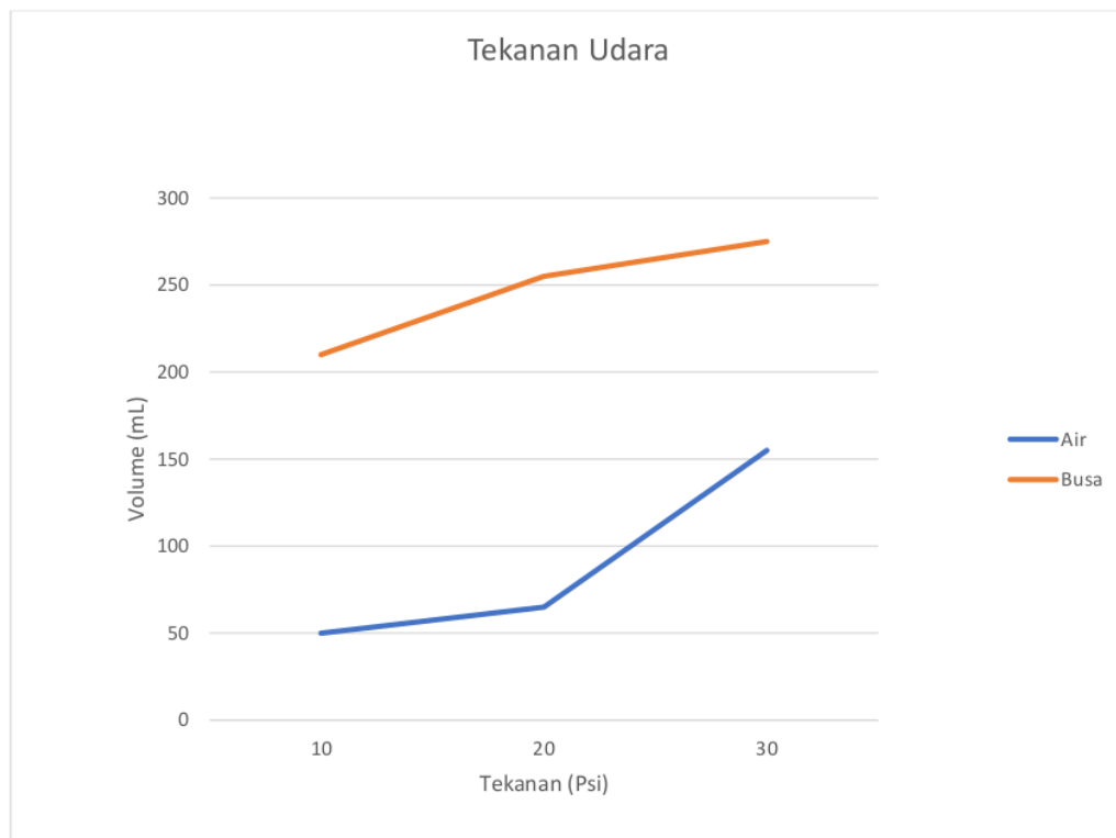
Grafik 1. Hasil Uji Tekanan

Hasil uji tekanan menggunakan kompresor pada sprayer yang dimodifikasi dapat memberikan beberapa informasi penting terkait performa dan efisiensi penyemprotan, yang sangat relevan bagi pengguna dalam memilih alat yang tepat untuk kebutuhan pembersihan. Uji ini bertujuan untuk mengukur tekanan optimal yang dihasilkan oleh kompresor, guna memastikan bahwa sprayer berfungsi secara optimal dan menghasilkan hasil yang diharapkan. Tekanan yang terlalu rendah dapat menghasilkan semburan yang tidak merata, sehingga mengakibatkan area tertentu tidak terjangkau dengan baik, sementara tekanan yang terlalu tinggi dapat merusak sprayer , berpotensi menyebabkan kebocoran atau kerusakan pada komponen internal alat. Dengan memahami batasan tekanan ini, pengguna dapat mengoptimalkan penggunaan sprayer , meningkatkan efisiensi pembersihan, dan memperpanjang umur alat. Oleh karena itu, pengujian tekanan ini sangat penting untuk menentukan parameter yang tepat, sehingga dapat digunakan dalam berbagai situasi dengan hasil yang konsisten dan memuaskan.