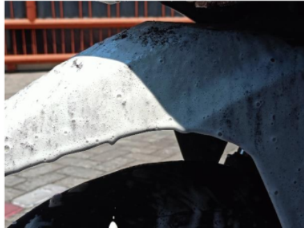
Gambar 4. Spakbor dengan tekanan 10 Psi