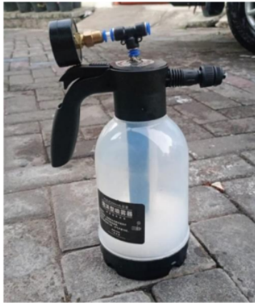
Gambar 1. Sprayer