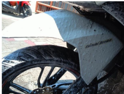
Gambar 5. Spakbor dengan tekanan 20 Psi