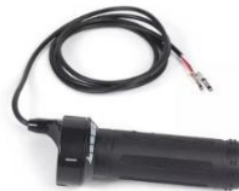
Gambar 7. Handle Gas

Handle gas berfungsi untuk mengatur kecepatan listrik, ada 3 model yang sering digunakan yaitu handle gas tarik atau throttle control, thumb throttle control, dan pedal assist system (PAS).