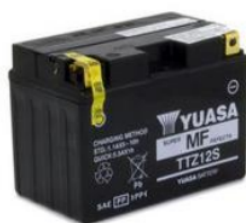
Gambar 4. Accu Kering

Aki kering merupakan jenis aki yang tidak membutuhkan cairan elektrolit. Sebaliknya, aki ini menggunakan gel elektrolit yang terkandung dalam separator, sehingga tidak memerlukan perawatan khusus dan tidak memerlukan pengisian air elektrolit secara berkala. Sel listrik yang dikenal sebagai accu kering memungkinkan reaksi elektrokimia reversibel yang sangat efisien. Proses elektrokimia reversibel (juga dikenal sebagai proses pelepasan) mengacu pada kemampuan baterai untuk mengubah bahan kimia menjadi energi listrik, dan Sel listrik yang dikenal sebagai accu kering memungkinkan reaksi elektrokimia reversibel yang sangat efisien. Proses elektrokimia reversibel (juga dikenal sebagai proses pelepasan) mengacu pada kemampuan baterai untuk mengubah bahan kimia menjadi energi listrik. [6]