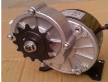
Gambar 2. Motor Penggerak (Dinamo)

Motor Penggerak adalah karakteristik utama yang dimiliki oleh sepeda listrik. Komponen yang lebih umum disebut dinamo bekerja dalam mengubah energi listrik dari baterai menjadi energi mekanis atau gerak. Sumber tegangan DC memberi daya pada motor listrik jenis ini. Arus maju, arus balik, tegangan positif, dan tegangan negatif pada motor DC menentukan arah putaran motor DC.[4]