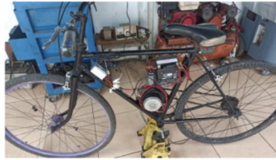
Gambar 8. Sepeda Listrik