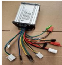
Gambar 6. Controller

Controller motor yang berfungsi untuk mengatur kecepatan dan kelistrikan pada sepeda listrik. Nilai prelabel kecepatan variabel aritmatika digunakan, untuk menyelesaikan pengaturan kecepatan putar dalam skala besar secara akurat.