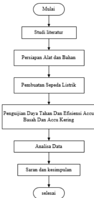
Gambar 1. Diagram Alur Penelitian

Diagram alir ini dibuat supaya penelitian ini dapat terlaksana sesuai dengan tahapan dan menghindari kekeliruan pada saat melakukan penelitian. Oleh karena itu dibuat sebuah diagram alur pada penelitian ini sebagai berikut.