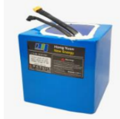
Gambar 5. Baterai Lithium-Ion

Baterai lithium ion adalah baterai yang berjenis isi ulang ( Rechargeable Battery ). Di dalam baterai ini terdapat bagian ion litium yang bergerak dari elektrode negatif ke elektrode positif pada saat baterai digunakan. Baterai ini merupakan jenis baterai isi ulang yang paling populer dalam peralatan elektronik, karena memiliki sumber energi yang paling baik. Ketika baterai ini habis dan diisi ulang, ion lithium bermigrasi dari elektroda negatif ke elektroda positif. Tidak seperti baterai lithium yang tidak dapat diisi ulang, yang menggunakan lithium logam sebagai bahan elektrodanya, baterai lithium-ion menggunakan senyawa lithium interkalasi.