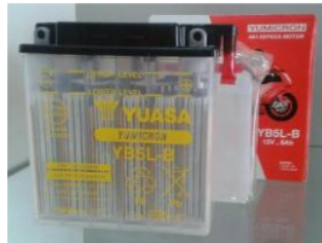
Gambar 3. Accu Basah

Accu Basah merupakan Baterai model basah, atau yang mengandung cairan asam sulfat ( H_2SO_4 ), adalah jenis baterai ini. Ketika reaksi kimia terjadi antara sel dan air baterai, fitur utama memiliki lubang dengan penutup yang membantu meningkatkan air baterai ketika hampir habis karena penguapan. Sel-selnya terbuat dari timbal (Pb). Kekurangan baterai ini adalah pengguna perlu waspada untuk sering mengecek ketinggian air pada baterai. Zat ini sangat korosif. Hidrogen, komponen uap air baterai, mudah terbakar dan meledak saat terkena percikan api. memiliki tingkat self discharge tertinggi dari baterai apa pun, yang mengharuskan sengatan listrik kembali ketika dibiarkan terlalu lama.[5]