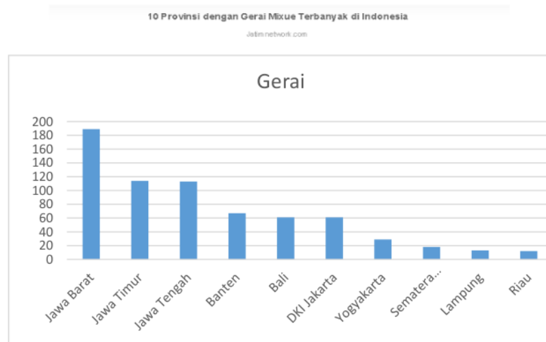
Gambar 1 Gerai Mixue terbanyak di Indonesia