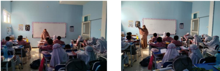
Gambar 1 (Guru Menggunakan Metode Ceramah)

Berdasarkan hasil dokumentasi yang diperoleh dari catatan pelaksanaan pembelajaran dan penilaian menunjukkan bahwa metode ceramah, diskusi kelompok, dan pemberian contoh perilaku yang baik. Strategi yang diterapkan termasuk penguatan positif, pemberian tugas yang terarah sering digunakan dalam pembelajaran Akidah Akhlak. Penilaian yang dilakukan oleh guru juga mencakup aspek tanggung jawab siswa dalam menyelesaikan tugas tepat waktu, partisipasi aktif dalam diskusi, dan sikap selama proses pembelajaran.