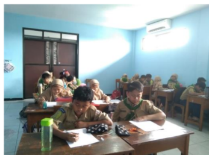
Gambar 2 (Siswa mengerjakan tugas yang diberikan oleh guru)