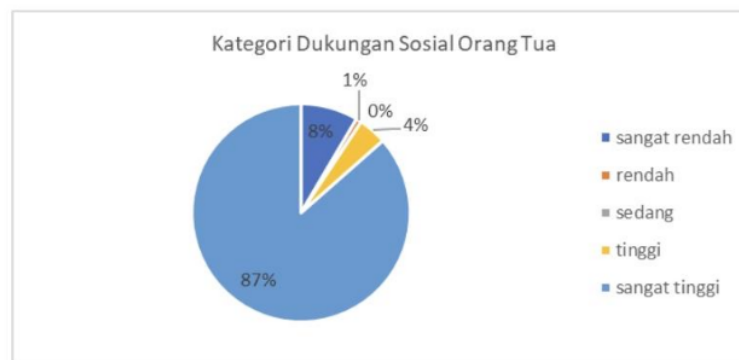
Diagram 1 Kategorisasi Dukungan Sosial Orang Tua