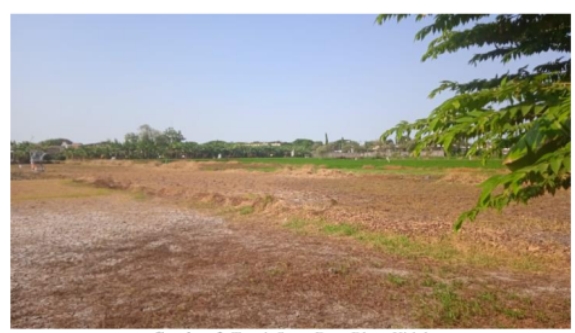
Gambar 3. Tanah Sewa Desa Bluru Kidul

biaya untuk perawatan tanah tersebut sehingga hasil yang diperoleh juga cukup banyak. Berikut merupakan tanah bengkok yang disewakan oleh Pemerintah Desa Bluru Kidul dalam meningkatkan PADes sebagai berikut: