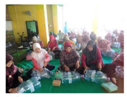
Gambar 2. Pelatihan Ibu-Ibu PKK Desa Bluru Kidul

Wawancara diatas dapat diketahui bahwa pemerintah Desa Bluru tidak hanya memberikan sosialisasi di lingkungan internal saja tetapi juga kepada BUMDes dan Ibu-ibu PKK. Serta pemerintah Desa juga memberikan pelatihan-pelatihan yang melibatkan ibu-ibu PKK. Berikut merupakan salah satu dokumentasi Ibu-ibu PKK dalam mendaur ulang bahan bekas plastik sebagai berikut :