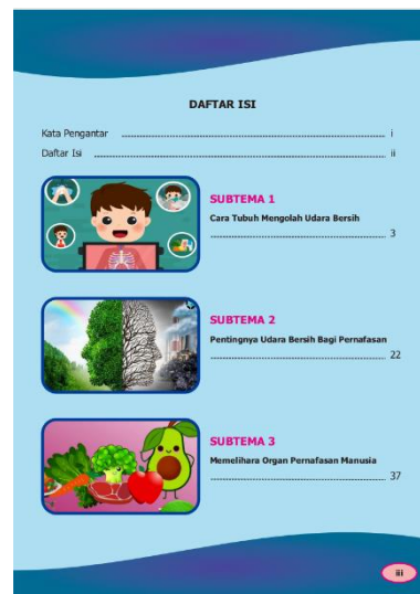
Gambar 2. Daftar Isi Modul Ajar