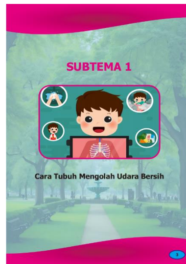
Gambar 4. Sampul Subtema 1