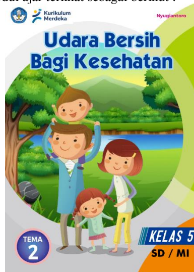
Gambar 1. Sampul Depan Modul Ajar

Desain modul ajar terlihat sebagai berikut :