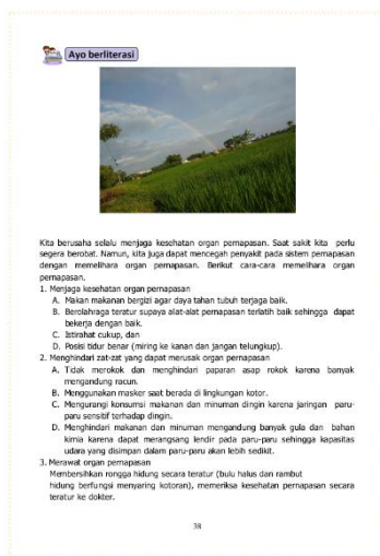
Gambar 13. Materi Subtema 3