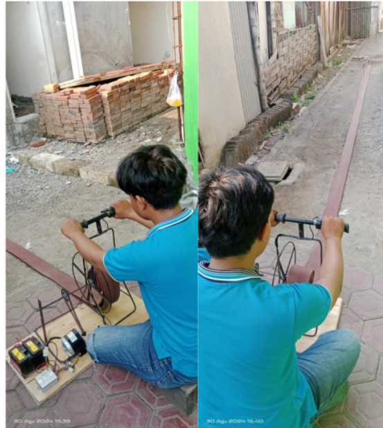
Gambar 4. Simulasi Penggulungan