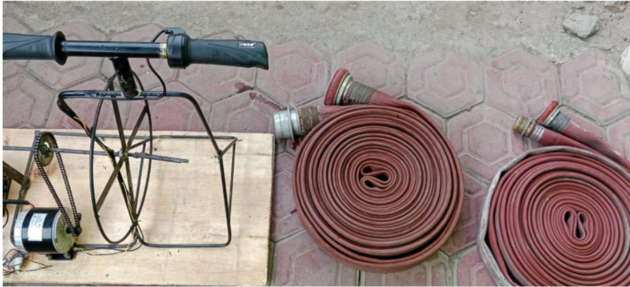
Gambar 3. Alat

Peningkatan waktu penggulungan dalam kondisi beban menunjukkan bahwa meskipun motor BLDC meningkatkan efisiensi dalam kondisi tanpa beban, perlu adanya optimasi lebih lanjut untuk menghadapi beban tambahan. Faktor-faktor seperti torsi motor, kemampuan pengendalian beban, dan pengaturan sistem kontrol mungkin perlu diperhatikan untuk meningkatkan performa alat dalam kondisi beban berat.