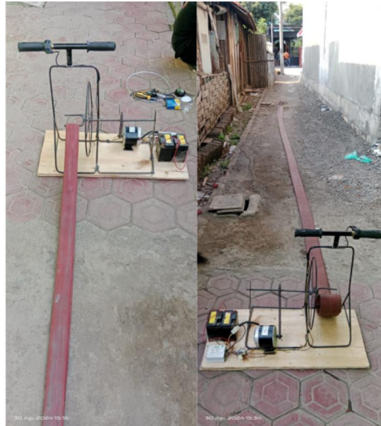
Gambar 5. Rancangan Motor