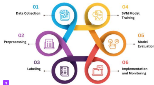
Gambar. 1. Magnetisasi sebagai fungsi yang terapkan. Berikan judul gambar yang jelas dan deskriptif

Penelitian ini akan akan memprediksi, mengeksplorasi beragam perspektif, dan pandangan yang tercermin apa saja yang mempengaruhi dalam pemilihan sebuah karir. Adapun alur dalam penelitian ini menggunakan 6 langkah, yaitu Data Collection, Preprocessing, Labeling, SVM Model Training, Model Evaluation, dan Implementation and Monitoring[14]. Gambar 1 merupakan alur dari penelitian ini.